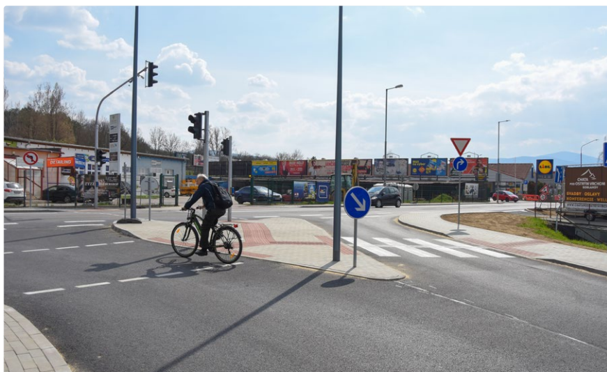
Cyklista na fotografii ide zle, vľavo z Bezručovej na Soblahovskú platí zákaz odbočenia.