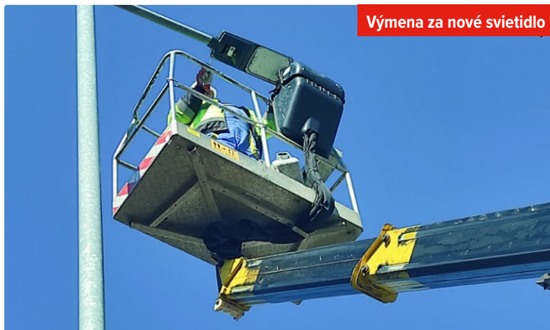
Výmena za nové svietidlo

Počas druhej etapy sa počíta s výmenou 1 070 nevyhovujúcich stožiarov verejného osvetlenia s príslušenstvom, s doplnením 135 nových svetelných bodov a s výmenou poruchových pod-