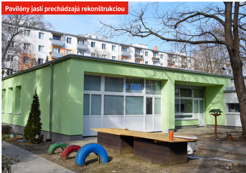
Pavilóny jaslí prechádzajú rekonštrukciou