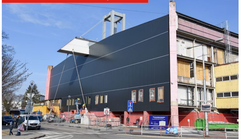
Rekonštrukcia zimného štadióna je viditeľná.

Niektoré práce sa so súhlasom poslancov mestského parlamentu urobí ešte navyše. Doplnia pôvodne plánovanú investíciu, aby štadión vyhovoval aj po komfortnej stránke počas významných medzinárodných športových turnajov, zápasov, ale aj kultúrnych podujatí. Pôjde napríklad o prístavbu, doplnenie vzduchotechniky pre šatne, potrubia na budúce odvetranie prevádzok, ale aj doplnenia