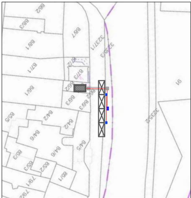
UMIESTNENIE STAVBY V KATASTRÁLNEJ MAPE, M=1:500