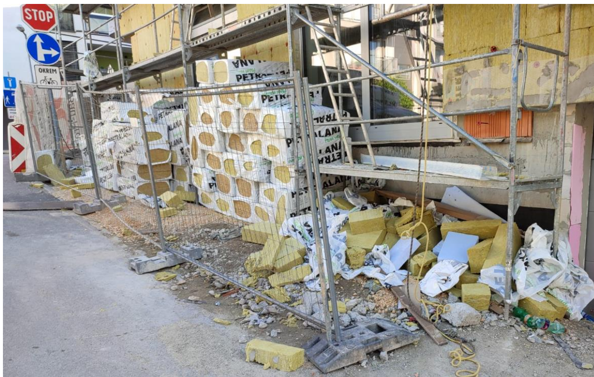
Nezabezpečený odpad na lešení aj po skončení pracovnej doby: