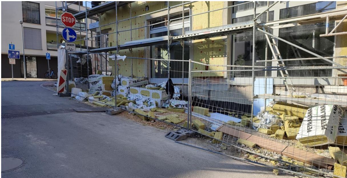
Rozfúkaný odpad na Ulici I. Olbrachta

Fotografie nižšie boli ofotené po upozornení 2.6.2023.