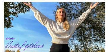
Citiš sa nespokojne? Hľadáš svoje naplnenie v živote?