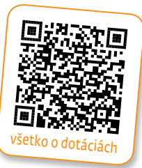
všetko o dotáciách

V grantovom programe mesta Trenčín bolo v tomto roku podaných v oblasti sociálnej a zdravotnej 35 žiadostí. Komisia sociálnych vecí a verejného poriadku pri Mestskom zastupiteľstve v Trenčíne odporučila schváliť 30 projektov a rozdeliť medzi ne 34213 eur: V zdravom tele, zdravý duch (Silnejší slabším, o. z.) 500 €, Kurz nordic walking zameraný na onkologického pacienta (OZ Amazonky) 1100 €, Hipoterapia u detí s autizmom (AUTIS) 400 €, Rodinná terénna terapia (Klub abstinentov) 900 €, Liečebno-rehabilitačný pobyt (Liga