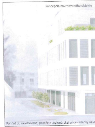
Pohľad do navrhovanej pasáže z Legionárskej ulice - ideový návrh

architektonická štúdia Polyfunkčný objekt Legionárska 23:: ideové vizualizácie