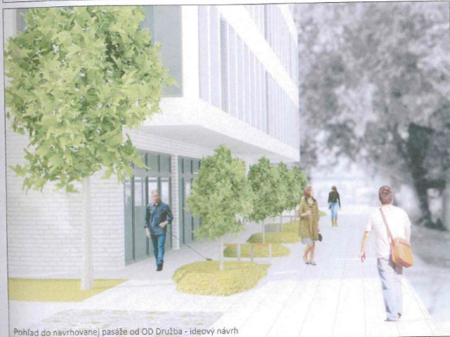
Pohľad do navrhovanej pasáže od OD Družba - ideový návrh

Vznášajúci: Ing arch. Michal Vojtek, TFKT s r.o. Trenčín, 10/2021