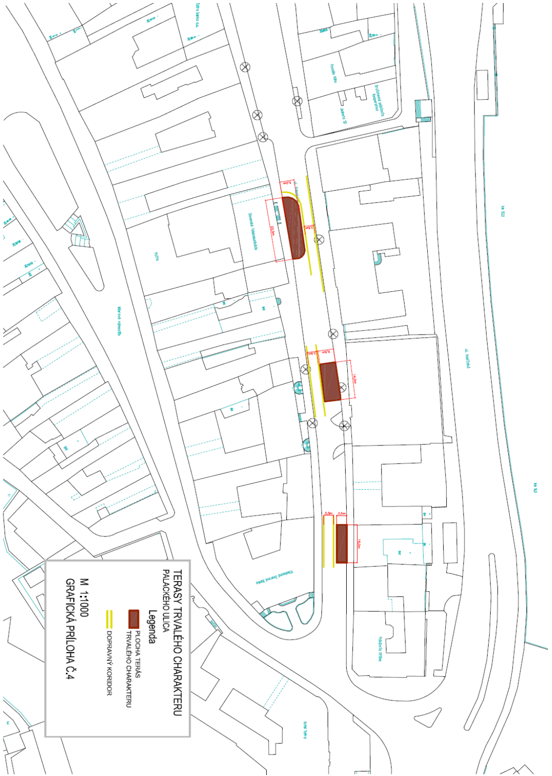
TERASY TRVALEŠHO CHARAKTERU PALACKÉHO ULICA Legenda ■ PLOCHA TERÁS TRVALEŠHO CHARAKTERU ■ DOPRAVNÝ KORIDOR M 1:1000 GRAFICKÁ PRÍLOHA Č.4