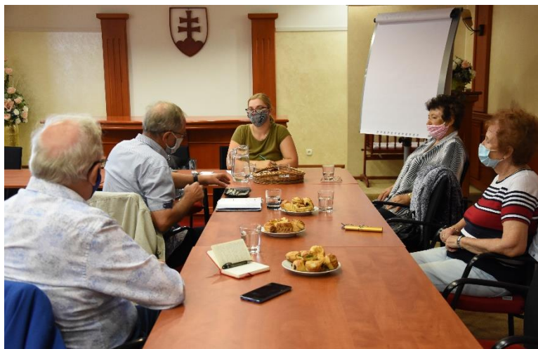
Diskutovalo sa aj s trenčianskymi seniormi.

ných a študenti stredných aj vysokých škôl, rodičia detí, marginalizované a znevýhodnené skupiny obyvateľstva, poslanci mesta, náboženské skupiny, športovci, umelci, tanečníci, minoritné