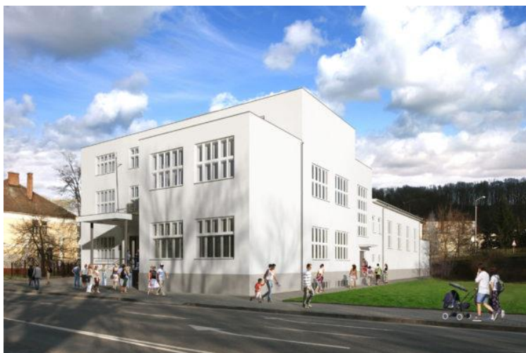
Vizualizácia kultúrneho centra Hviezda po rekonštrukcii.

Dotáciu viac ako 7,6 milióna eur na kompletnú rekon-