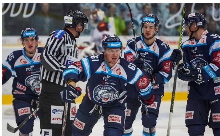
Najviac sezón strávil v českej lige v drese Liberca.

„Čo je profesionalita, to som pochopil v Amerike. Najlepší ľudia boli zároveň najväčšími hviezdami. Bol som z toho prekvapený. Mal som dvadsaťjeden rokov. Prišiel za mnou Daniel Briere, ktorý bol najproduktívnejším hráčom tímu. Vraj dobre korčuľujem, len ešte potrebujem popracovať na tréningoch na zakončení. Vtedy som pochopil, ako hviezdny hráčom záležalo na tom, aby dobre šliapal celý tím. Na Slovensku sa v tom čase starší hokejisti báli o svoje pozície.“