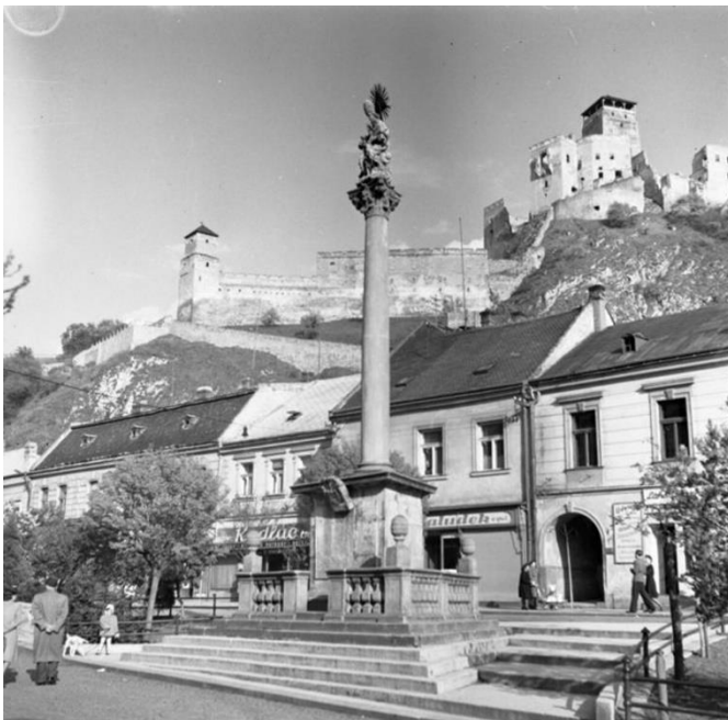
Morový stĺp v Trenčíne v 50. rokoch 20. storočia.

Ešte predtým, v máji 1708, v Trenčíne zúril jeden z tých požiarov, ktoré zvykneme označovať prívlastkami ako fatálne.