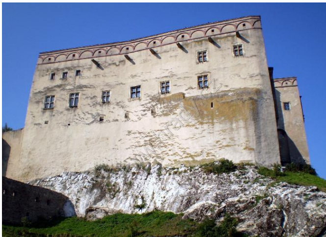
Barborin palác na Trenčianskom hrade.

Kráľovná bola v roku 1419 pre neveru v nemilosti vypovedaná do Sedmohradska, manželia sa však neskôr uzmierili. Krátko pred Žigmundovou smrťou bola Barbora znova obviňovaná, tentokrát z účasti na sprisahaní a zatknutá. Väčšinu jej hornouhorských majetkov vrátane Trenčianskeho hradu jej za trest v roku 1439 odobral jej zať Albrecht Habsburský , ktorého Žigmund určil za svojho následníka. Albrecht dal hrad najskôr svojej manželke Alžbete, dcére Žigmunda a Barbory