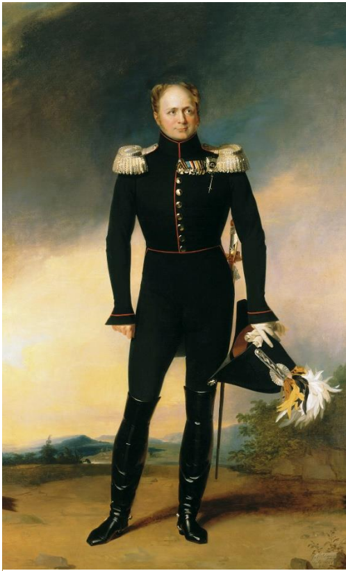
Ruský cár Alexander I.

Revolučné myšlienky sa rýchlo šírili po kontinente a nevyhli sa ani územiu Uhorska ovládaného Habsburgovcami. Na jeho území skupinka tzv. „uhorských jakobínov“ v roku 1794 plánovala po francúzskom vzore vyhlásenie republiky a tiež federalizáciu krajiny. Zaujímavé je, že išlo o prvý známy politický program, v ktorom sa uvažovalo o Slovensku ako o samostatnej federatívnej krajine v rámci Uhorska. Sprisahanie bolo odhalené a organizátori popravení.