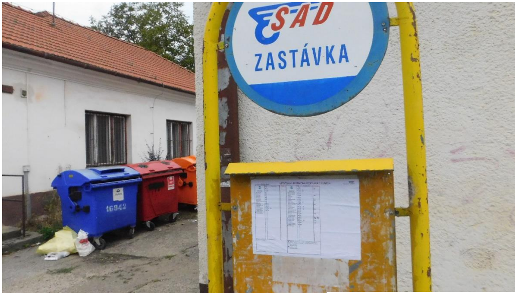
Zastávka Záblatie, pošta

Dopravca po našom upozorení v marcových požiadavkách VMČ pristúpil k výmene niektorých dočasných označiek MHD za riadne – farebné. Za tento krok dopravcovi ďakujeme, avšak zastávky Záblatie, pošta (smer Záblatie, Rybáre) a Priemyselný park (v areáli AUO) sú naďalej vybavené nevhodnými označkami, dočasného rps. prímestského charakteru. Nakoľko od nahlásenia podnetu uplynuli už 3 mesiace, prosíme o informáciu, kedy budú doplnené aj zvyšné dva označky?