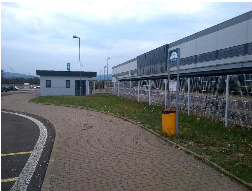
Zastávka Priemyselný park