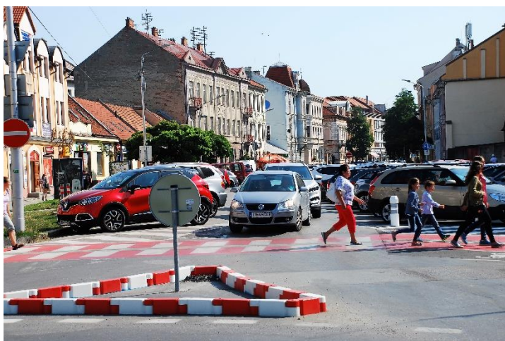
Poslanci schválili dvojnásobný nárast hodinovej sadzby na Palackého ulici.

Od júla sa zmení čas spoplatnenia v centre, kým doteraz vodiči platili za parkovanie od 8.00 do 18.00 hodiny, nový návrh