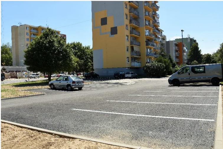
Sihot' III – ani nové parkovisko na ulici Pod Skalkou zatiaľ mesto nespoplatní.

„Tváriť sa, že Trenčín je jedno parkovisko, jedno miesto a parkovacia politika je len jeden parkovací projekt, je nezmysel. No ale my musíme počkať, ako sa k tomu postaví minister-