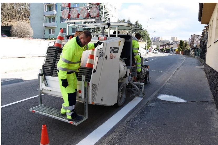
Vodorovné dopravné značenie obnovovali aj na Partizánskej ulici.

V pondelok 25. marca sa začalo s vyznačovaním vodorovného dopravného značenia na miestnych komunikáciách. Obnovené budú i niektoré parkovacie miesta, ktoré boli doteraz