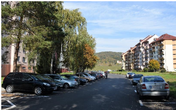
Nové parkovacie miesta pribudli aj na Sibírskej ulici na sídlisku Sihot.

Viac ako dva roky trvalo, kým mesto stanovilo termín spoplatnenia najväčšieho sídliska v Trenčíne. Na Juhu býva viac ako 20-tisíc obyvateľov, parkovacích miest je aktuálne málo. Mesto tu vybudovalo viac ako 800 parkovacích miest, obyvatelia majú obavy, že to pravdepodobne nebude stačiť.