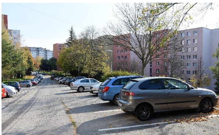
Na sídlisku Juh sa spoplatnenie parkovania odkladá.

„Predstavte si, že máte celé mesto Trenčín a máte 70 projektov, 70 parkovísk, niekde staviate 10, niekde 18, inde 25 parkovacích miest. Niekde len rozširujete cesty, kde by mohol vzniknúť priestor pre zaparkovanie áut. A bratislavské Združenie