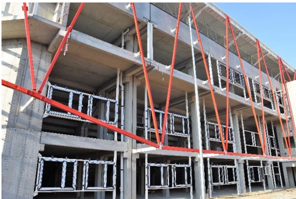
Prelom rokov 2019 – 2020.