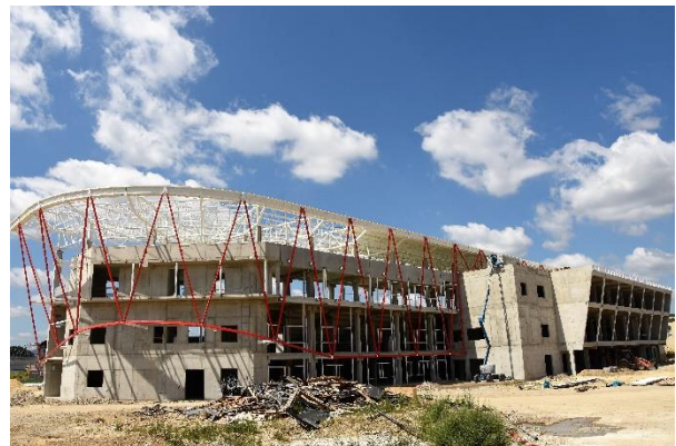
Streda 24. júla.