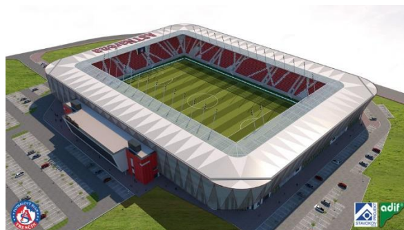
Vizualizácia nového futbalového štadióna.