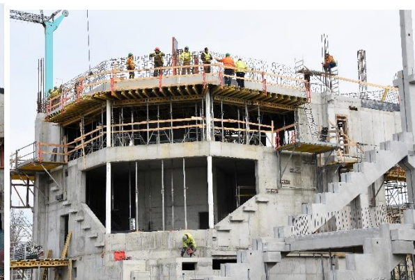
Utorok 19. marca.