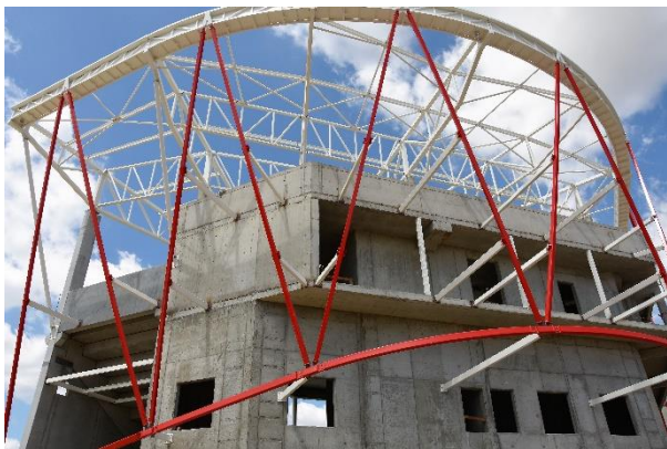
Streda 24. júla.