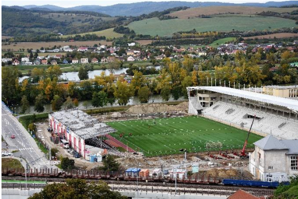
Piatok 11. októbra – pohľad z Trenčianskeho hradu.