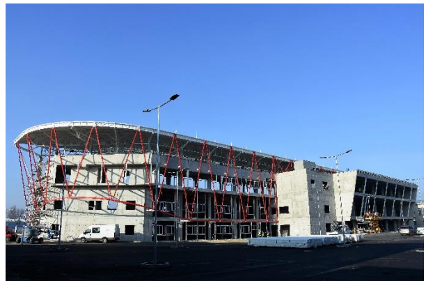
Prelom rokov 2019 – 2020.