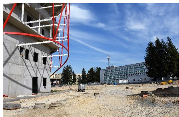
Utorok 24. septembra.