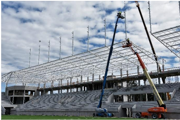
Piatok 31. mája.