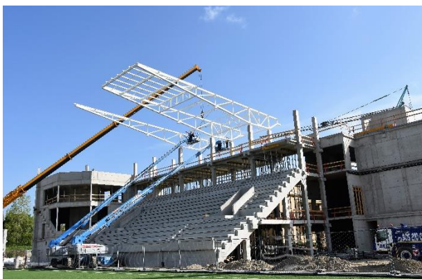
Štvrtok 25. apríla.