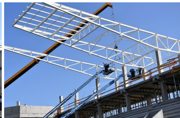
Štvrtok 25. apríla.