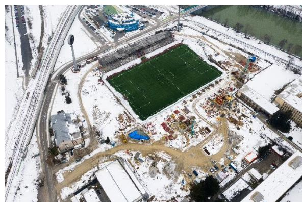
Január 2019 – stavenisko z vtáčej perspektívy.