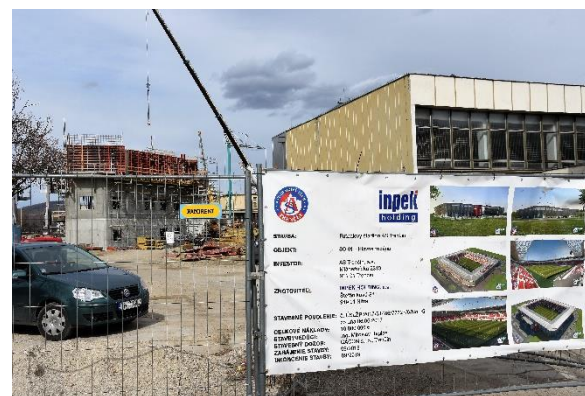
Piatok 8. marca – vstup do areálu.