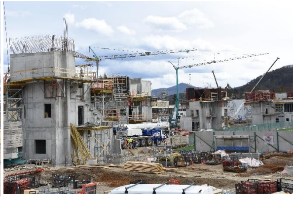
Piatok 8. marca.