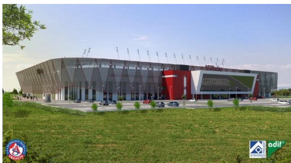
Vizualizácia nového futbalového štadióna.