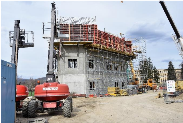
Piatok 8. marca.