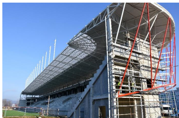
Prelom rokov 2019 – 2020.