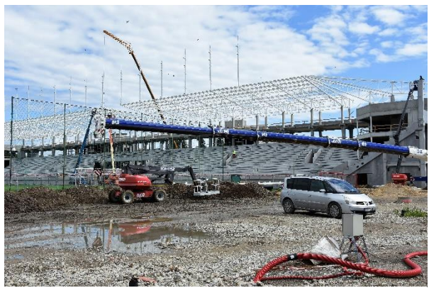
Piatok 31. mája.