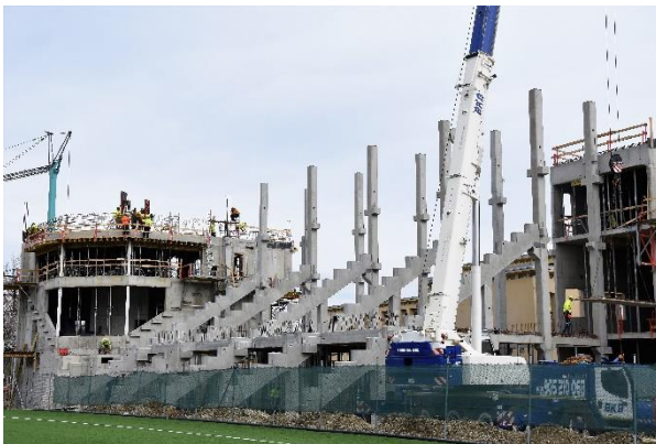
Utorok 19. marca.