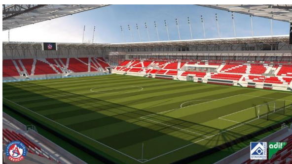
Vizualizácia nového futbalového štadióna.