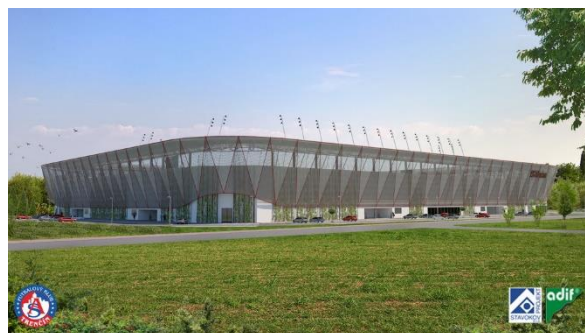
Vizualizácia nového futbalového štadióna.