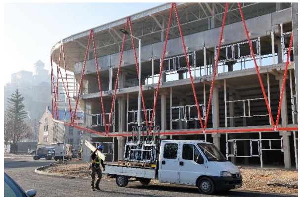
Prelom rokov 2019 – 2020.