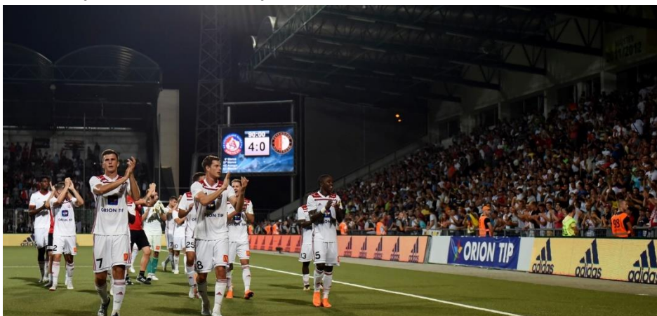
Štvrtok 9. augusta 2018 priniesol európsku futbalovú senzáciu: AS Trenčín – Feyenoord Rotterdam 4:0.

„Výber kvalitných hráčov vám nezaručí výsledky, ak