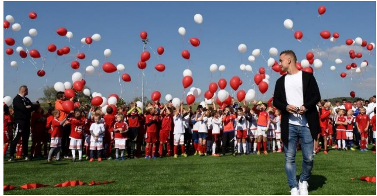
Novú trenčiansku futbalovú akadémiu otvoril Stanislav Lobotka.

V čom najmä pocítil klub úľavu po výstavbe nových ihrísk? „Naraz môže trénovať viacero družstiev. Tréningy prebiehajú v lepších časoch. Vhodné podmienky majú k dispozícii aj hráčky našich ženských a dievčenských tímov. Zázemie nám pomáha aj pri organizácii mládežníckych turnajov a atraktívnych prípravných zápasov. Dnes už vieme pritiahnúť kvalitných súperov z Česka, Maďarska a Poľska.“