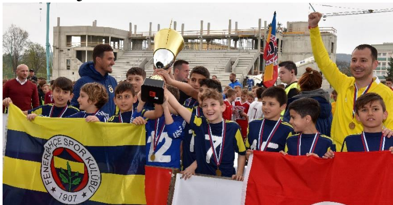
Chlapci z Fenerbahce Istanbul oslavujú zisk víťazného pohára.

Tím v bielych dresoch sedem zápasov vyhral, päť remizoval a trikrát prehral. Po tešil skvelou defenzívnou hrou, keď v pätnástich stretnu-