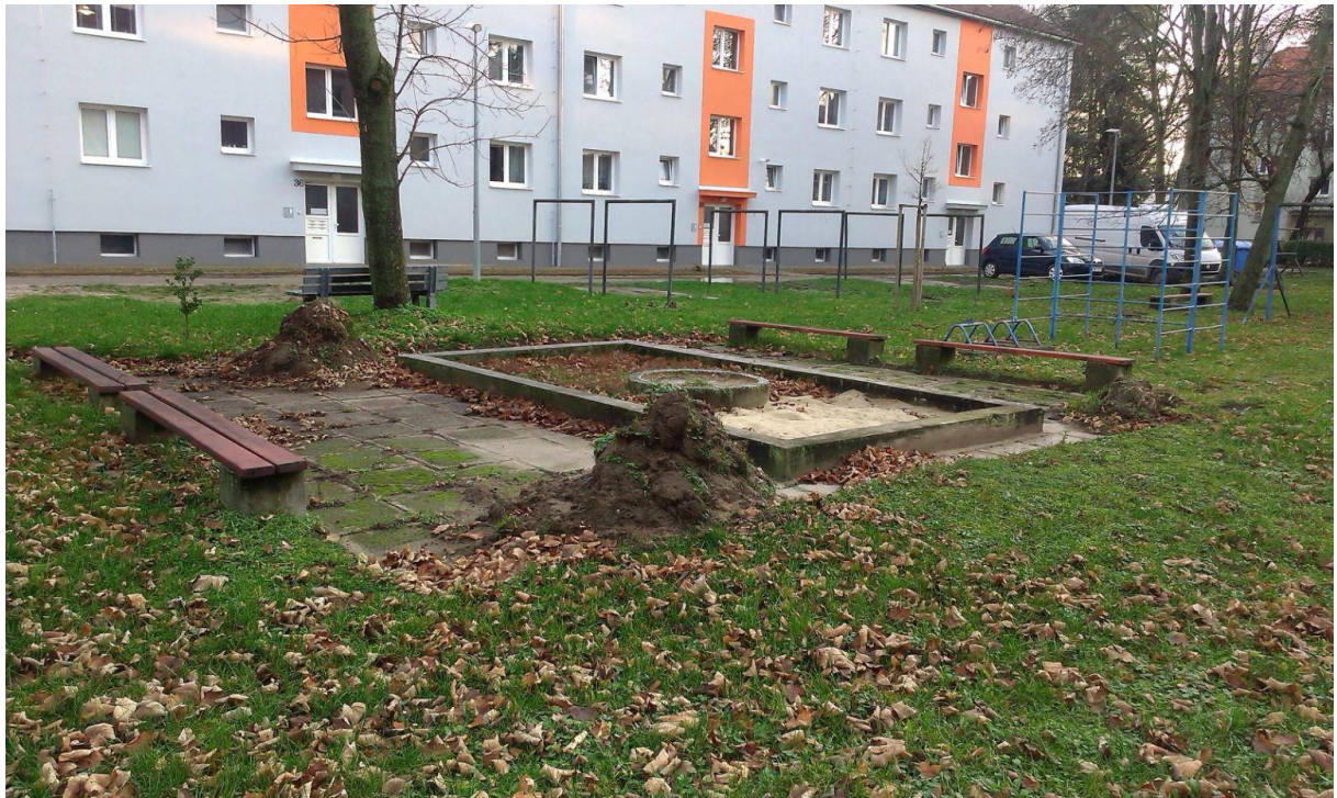
Stav k 22. novembru 2017