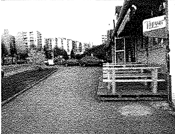
Letná terasa POČTA Zdeněk-VINÉRIA, ul.g.L.Svobodu 3063/1, Trenčín