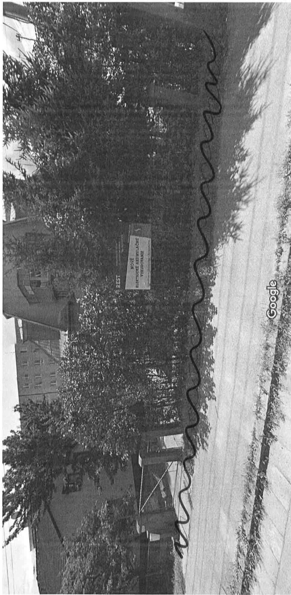
Vytvorenie snímky: júl 2014