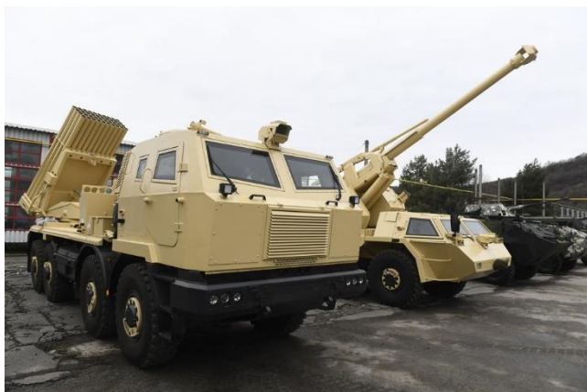
Raketomet a kanónová húfnica Dana.

„Tatra je silná značka a presun výroby aj na Slovensko je bezpochyby dobrou správou. Posilňuje to portfólio a ponuku slovenského obranného priemyslu a zvyšuje špecializáciu i