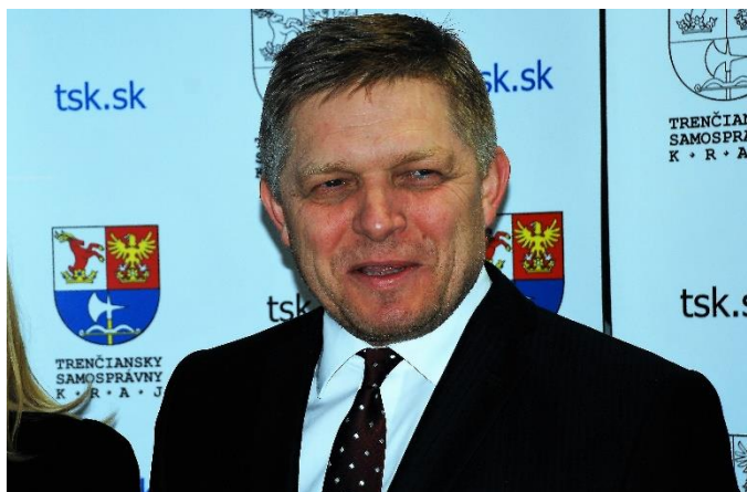
Premiér Robert Fico počas návštevy Trenčína.

„Predstavitelia spoločnosti ma informovali, že bolo veľmi správne rozhodnutie vlády, že firmy, ktoré investujú do vývoja a výskumu, si môžu 25 percent odpísať ako nákladovú položku. Požiadali ma, či by vláda nemohla uvažovať o zvýšení tohto percenta. V roku 2015 na tento účel bolo použitých 20 miliónov eur, slovenské firmy využili iba deväť miliónov eur, čo znamená, že nie je tendencia zneužívať tento systém. Po dohode s ministrom financií budeme navrhovať, aby sme zvýšili túto hranicu z 25 na 50 percent,“ zdôraznil premiér.