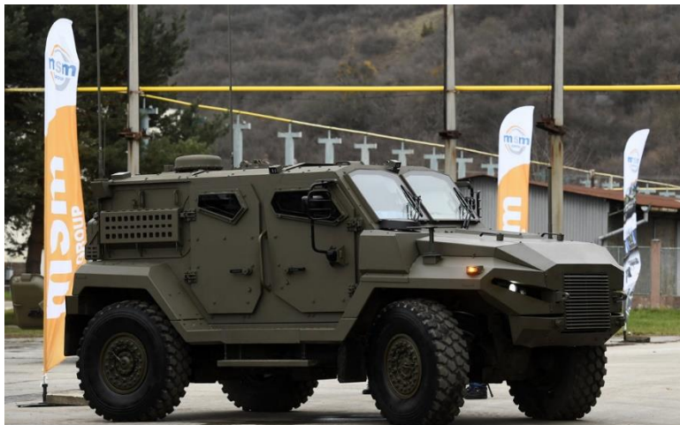
Obrnené taktické vozidlo KBV – 12 Patriot.

Spoločnosť MSM v spolupráci s Tatra Trucks Kopřivnice vytvorili spoločný podnik Tatra Slovakia. V ňom si má do troch