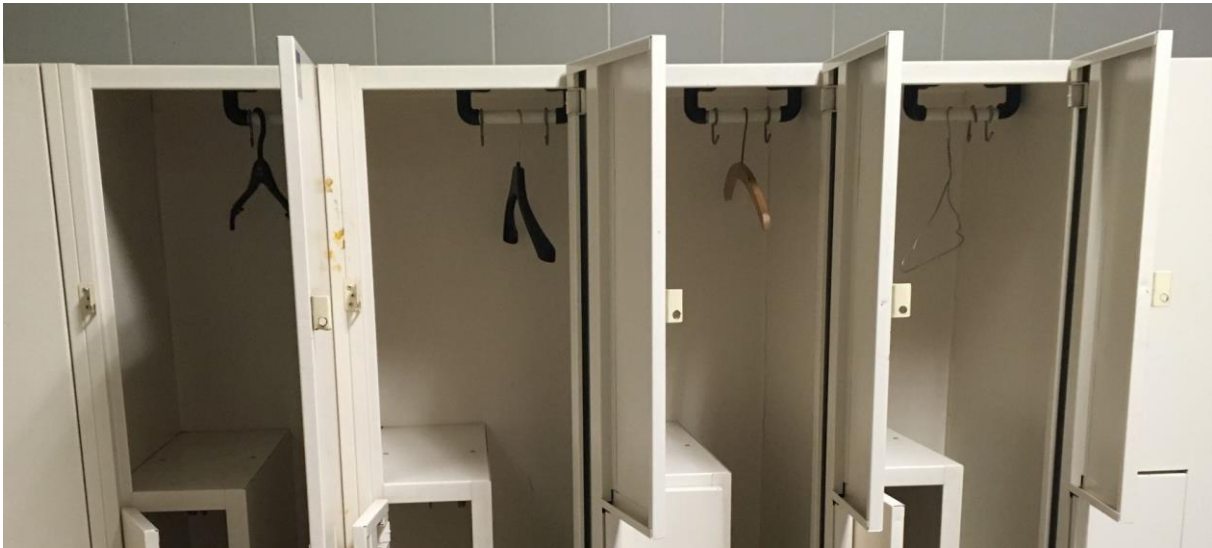
Aktuálny stav na mestskej plavárni.

Ročne sa dopĺňa cca 2 000 vešiakov, nebolo by rozumnejšie používať hotelové verzie? Kde horná časť vešiaku je pevne spojená so skrinkou a samotný vešiak je uchytený len prostredníctvom upínacieho mechanizmu. Vešiak je prakticky rozdelený na 2 časti. Kde nie je možné hornú časť odcudziť. Tým je vešiak nepoužiteľný v domácnosti. Je možné tento typ vešiaku otestovať napr. na mesiac a následne vyhodnotiť počet odcudzení? Typ hotelového vešiaku uvádzam v grafickej prílohe nižšie.