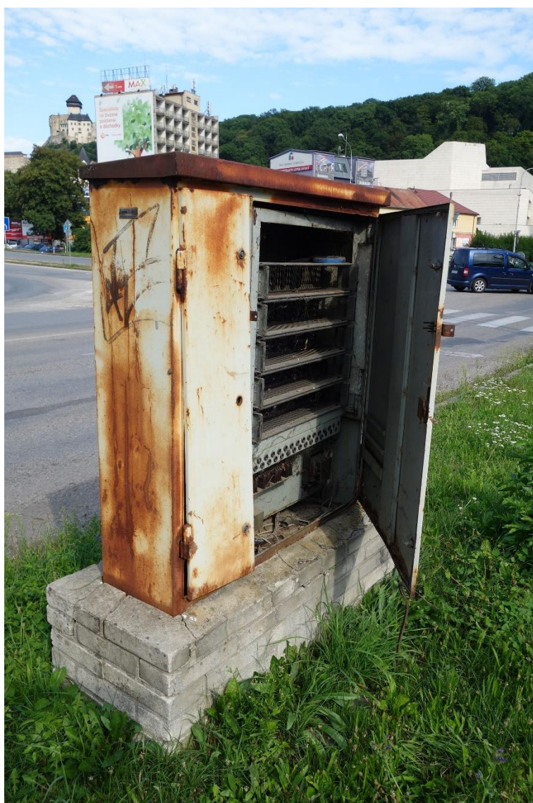
Stav k 9.8.2016