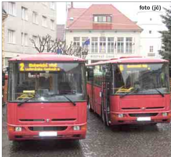
Nové autobusy boli pristavené na Mierovom námestí v piatok 16. decembra popoludní. V tejto dobe bolo možné si prezrieť interiér autobusov.

mil. Sk bez DPH, čo činí spolu takmer 23 miliónov.