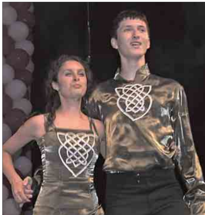
Dvojica tanečníkov zo skupiny írskych tancov Orin pricestovala z Nového Mesta nad Váhom. Tancujú v tamojšom Centre voľného času pod vedením J. Heveryovej.

zabezpečovali predovšetkým z finančných zdrojov rodičov. Potrebovali by sme zrekonštruovať koncertnú sálu, vymalovať triedy, chodby, ale stále ne-