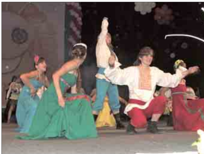
Pôvabné ježibaby v podaní tanečného súboru Goonies.

V práci s našimi žiakmi sa nám darilo. Teší nás, že sme nemali žiadne problémy so záškoláctvom, drogami, alkoholom. Že naši žiaci nerobili