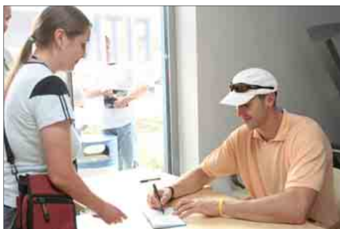
Z. Cháru záujem fanyniek očividne potešil a tak k podpisu pridal aj úsmev.

Štvorstranu pripravili T. Hlobeň a L. Kužela