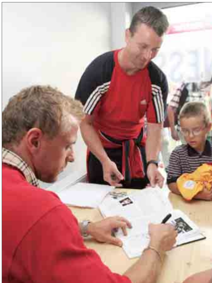
M. Gáborík počas autogramiády.

Hviezdny hokejista nezaбудol ani na mesto Trenčín: „Mesto nám vyšlo v ústrety predajom pozemku za symbolickú korunu a tak sa na ľad dostanú aj Trenčania počas verejného korčuľovania.“