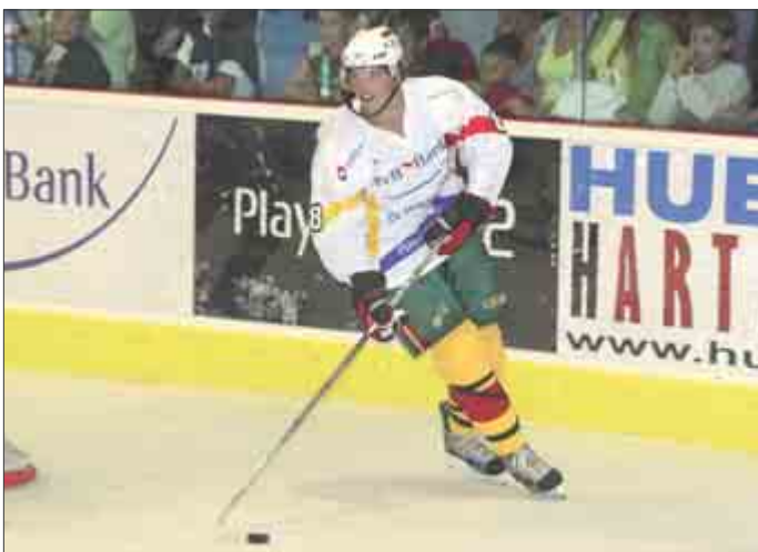
Host z Ameriky B. Burns, Gáboríkov spoluhráč z Minnesoty.