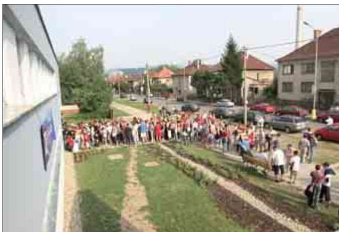
Takto to vyzeralo v sobotu 30. júla pred vchodom do MG Rinku.