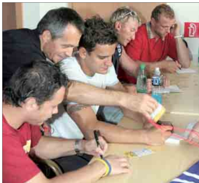
M. Gáborík podpisuje úplne vpravo, vedľa neho sa tej istej činnosti venujú Marcel Hossa a B. Radivojevič.

Investícia do mládeže sa Trenčanom vždy oplátila. Aj teraz sa na novú sezónu pripravuje s áčkom prakticky celá päťka z juniorky. „Bude záležať len na nich, či si vybojujú miesto v zostave. Niektorí budú, ale určite pendlovať medzi áčkom a béčkom v Považskej Bystrici,“ neskrýva šancu pred mladými trenčiansky hokejový prezident. Veď dnes je dobrý mladý hokejista aj výborným vývozným artiklom: „Verím, že vychováme ďalších mladých hráčov, ktorí pôjdu do draftu z dobrých pozícií a to je pre klub finančný prínos.“