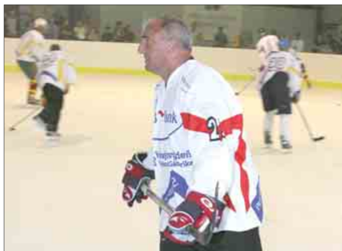
Dres Bielych obliekol aj reprezentačný tréner F. Hossa.