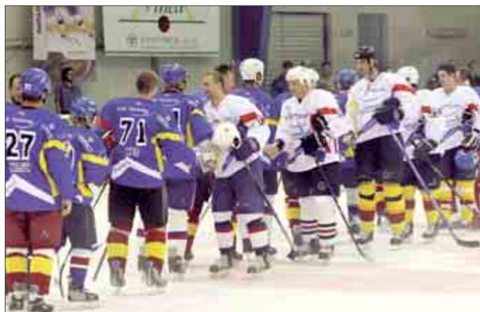
Úsmevy po zápase, v ktorom Bieli vyhrali 10:7.