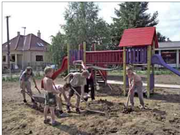
Deti pomáhajú pri výstavbe oddychovej zóny na Obchodnej ul. úplne spontánne, lebo ich to baví.

Túto filozofiu zvolil predseda VMČ spolu s kolegami aj na ostatných plochách, ktoré chcú dať do poriadku, keď odkroja svoju časť z koláča vo výške 8,4 mil Sk, ktorý je v rozpočte mesta určený na rekonštrukciu detských ihrísk. „ Na sídlisku Kvetná sme dali do poriadku najprv tie zóny, kde sa hrajú loptové hry, kde agresia lopty a prostredia môže spôsobiť úraz alebo ľaknutie. Preto sme to vybetónovali, urobili tam