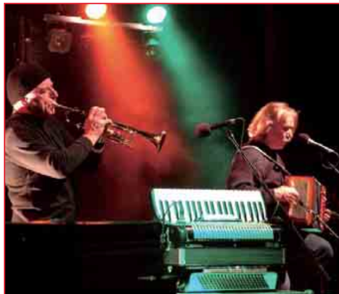
K vrcholom festivalu patrilo vystúpenie českej folkovej hviezdy J. Nohavicu (vpravo).

s tromi predpremiérami. „Diskusná“ Aréna TB priniesla rozhovory Pod lampou , projekt