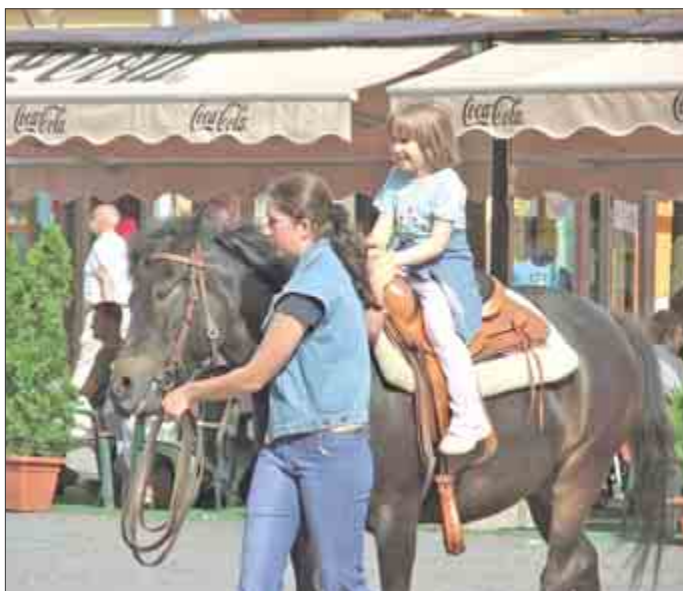
Deti vyskúšali jazdu na koňoch.

svoje si prišli aj portrétisti umne zachytávajúci návštevníkov vo forme karikatúry, či portrétu. Na ploche námestia bola aj malá výstavka pivných etikiet, katalógov a plagátov. Nemohol chýbať ani informačný panel o Trenčianskej nadácii.