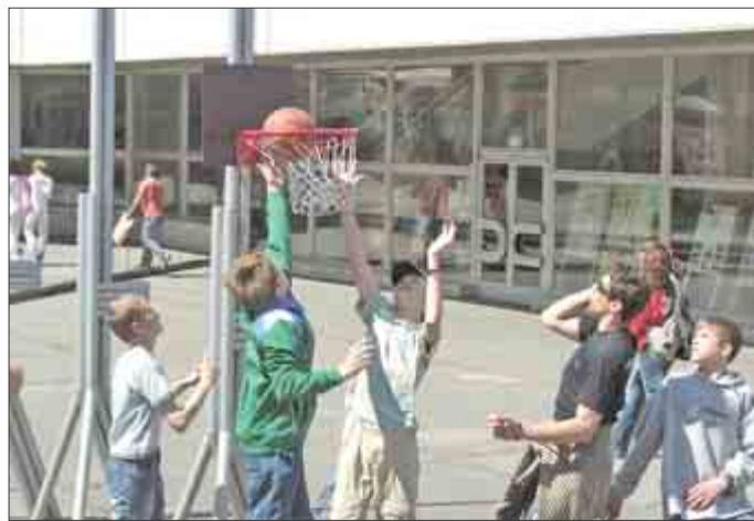
Basketbal sa hral pred KaMC OS SR (bývalý Dom armády).

Jarným slniečkom zaliate Mierove námestie vytvorilo podmienky aj pre ďalšie športové aktivity. Tretiačky zo ZŠ sv. Svorada a Benedikta skákali cez gumu a ďalšie dievčatá skúšali skákanie cez švihadlá. Rešpekt si získali deti z MŠ na Kubranskej ulici, za ktoré na otázku, ktorú z disciplín už absolvovali, odpovedali učiteľky: „Do centra mesta sme prišli s deťmi pešo z Kubrej. Takže prvú časť športovej aktivity majú deti za sebou. Skúsime ešte zdolať farské schody, ukážeme deťom Trenčiansky hrad a potom pôjdeme spať.“