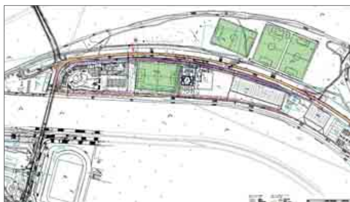
Ostrov s plánovanými cvičnými futbalovými ihriskami.