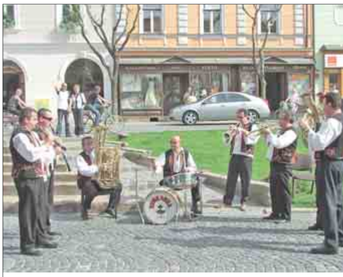
Organizátori z Trenčianskej nadácie tentoraz vsadili na nedeľný promenádny koncert dychovej hudby Kubranka.

žonglér. Deti vyskúšali jazdu v sedle na koňoch a dospelí sa pristavovali pri výčape s dobre vychladeným pivom, keďže podtitul znel Pivné korzo. Na