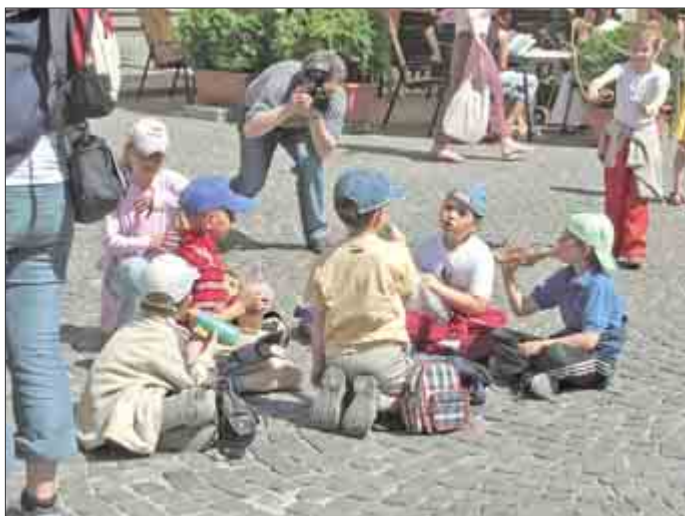
Riadny športový výkon aj unaví a miesto na občerstvenie sa vždy našlo.