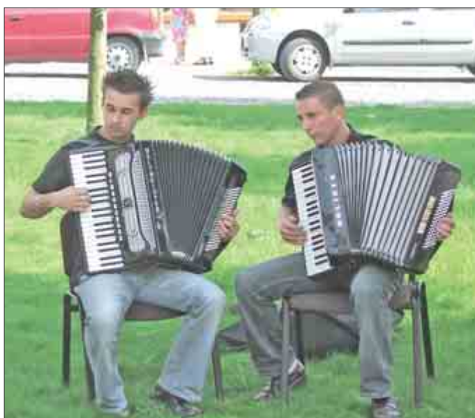
Program spestrili harmonikári zo ZUŠ Trenčín.