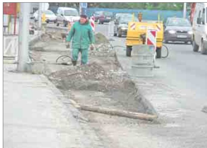
Ukončenie rekonštrukcie rozšírenia nástupíšť MHD na Hasičskej ulici v Trenčíne sa predpokladá podľa stanoviska dodávateľa Cesty Nitra do 30. júna t.r. Náklady rekonštrukčných prác na rozšírení nástupíšť MHD na Hasičskej ulici sa predpokladajú vo výške 10 miliónov Sk. Investorm je Slovenská správa ciest. Smerom na železničnú stanicu budú k dispozícii dve odstavné plochy pre autobusy (nová a pôvodná). Na opačnej strane smerom na Bratislavu a Bánovce n/B. bude používaná jedna predĺžená odstavná plocha. Text a foto (jč)