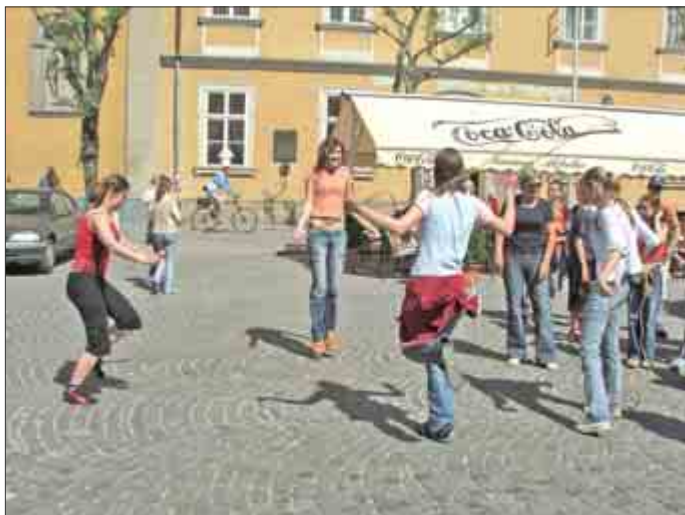
Na Mierovom námestí dievčatá skákali aj cez švihadlá.

Streda 25. máj bol „Dňom výzvy“, národnej súťaže miest s približne rovnakým počtom obyvateľov, pri ktorej sa občania zapojili do ľubovlných pohybových a turistických aktivít, ktoré zvýšili pulzovú frekvenciu a trvali nepretržite 15 minút. Súčasťou boli aj rôzne sprievodné kultúrno-spoločenské podujatia. Nie je to však súťaž v pravom slova zmysle, len pre zábavu sa porovnáva percentuálna zapojenosť obyvateľstva v súťažiacich mestách. V tento deň nakoniec zvíťazili všetci, ktorí sa zapojili a prežili atmosféru nevšedného dňa, vyhláseného Medzinárodnou organizáciou športu pre všetkých - TAFISA so sídlom vo Frankfurte nad Mohanom.