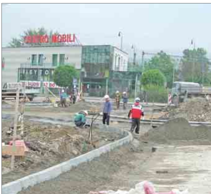
Stavebné práce na kruhovom objazde pri obchodnom dome Lidl pokračujú veľmi rýchlym pracovným tempom. Fotografia poskytuje už jeho základné kontúry.

Zisťovanie v domácnostiach sa koná od 20. mája do 30. júna 2005 . V tomto období vybrané domácnosti v Trenčíne navštívi pracovník poverený funkciou opytovateľa, ktorý je povinný sa v domácnostiach preukázať osobitným poverením. Všetky informácie a názory, ktoré budú v rámci tohto zisťovania domácnosti poskytnuté, sú anonymné a použijú sa výlučne len na štatistické účely. Ochranu dôverných údajov upravuje zákon č. 540/2001 Z.z. o štátnej štatistike. Za ochranu dôverných údajov zodpovedá Štatistický úrad SR. (ŠÚ SR, TN)