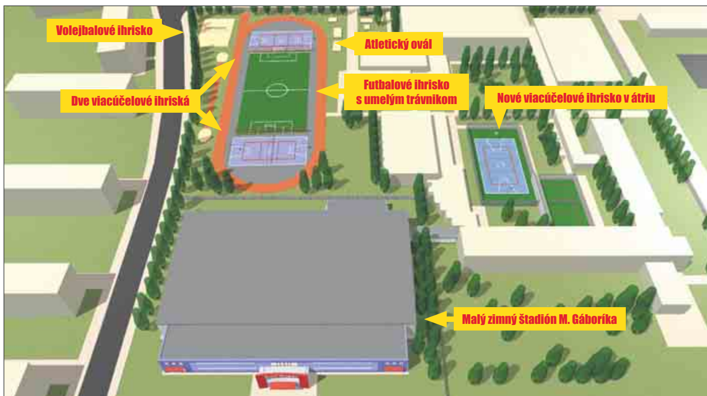
Budúci vzhľad areálu so znázornením športovísk.

Pri rekonštrukcii je počítané aj s novým osvetlením všetkých častí areálu, ako aj samostatným osvetlením športovísk. Široká verejnosť tak bude môcť využívať areál aj vo večerných hodinách. Jeho ovládanie bude manuálne regulovateľné. Prírodnú novú chodníky, odpadkové koše, stojany na bicykle a napríklad aj 32 nových lavičiek na sedenie. Na záver výstavby pribudne zeleň – celá plocha bude zatravnená. Výsadbou bariérovej zelene bude areál oddelený od okolia. V prípade zásahov do zelene a možného výrubu stromov budú tieto nahradené v plnom rozsahu v rámci plochy, ktorá je na tomto mieste k dispozícii.