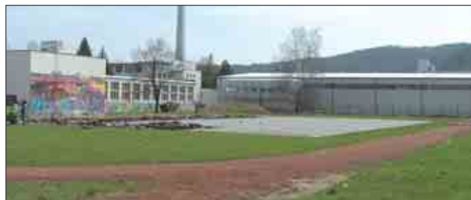
Prípravné práce už začali.

Svoje miesto si na novom školskom areáli nájdu malí predškoláci, školáci i maturanti. Hneď pri vstupe do areálu školy bude vybudované nové detské ihrisko s preliezkami a šmyčkovkami. Nové viacúčelové ihrisko je naplánované do átria medzi školskými objektmi, kde je v súčasnosti nevyužívaná asfaltová plocha. Jadro školského areálu – atletický ovál je plánovaný na jeho súčasnom mieste. V jeho strede