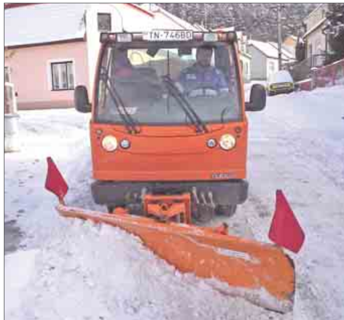
Štefan Ukuš na viacúčelovom vozidle Foma bezpečne zvládol aj svah na Partizánskej ul.

ciest, kde zabezpečujú zimnú údržbu pracovníci mestskej rozpočtovej organizácie Mestské