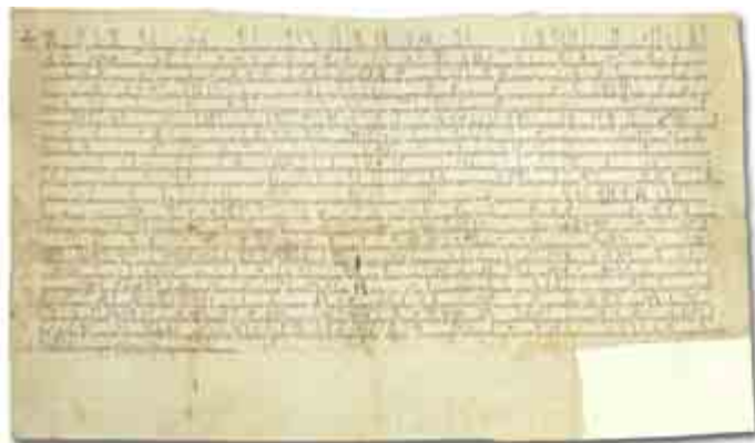
V zoborskej listine z r. 1113 je uvedený ako villa TRENCINIENSIS.

Dnes by sa odborníci mali vrátiť k preskúmaniu doterajších poznatkov onomastiky (náuka zaoberajúca sa vlastnými menami, ich pôvodom a historickým vývojom – pozn. red.) a etymológii (odbor zaoberajúci sa pôvodom slova, vzťahmi a príbuznosťou slov – pozn. red.) a potvrdiť pravosť v súčasnosti platného