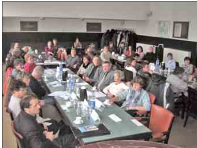
Predstavitelia trenčianskej kultúrnej obce zaplnili veľkú zasedačku mestského úradu takmer do posledného miesta.