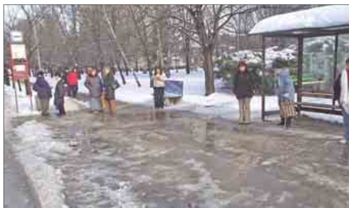
Chodník i autobusová zastávka na frekventovanej Soblahovskej ul. boli v súlade s operačným plánom zimnej údržby.