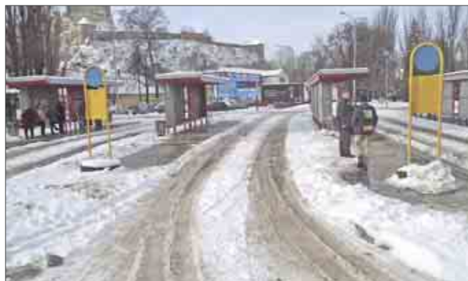
Pri krytých zastávkach na hlavnej autobusovej stanici boli v poriadku len chodníky.

Mobilný telefón použil aj pri hlavnej autobusovej stanici.