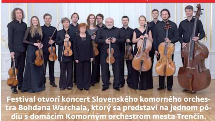
Festival otvorí koncert Slovenského komorného orchestra Bohdana Warchala, ktorý sa predstaví na jednom pódii s domácim Komorným orchestrom mesta Trenčín.