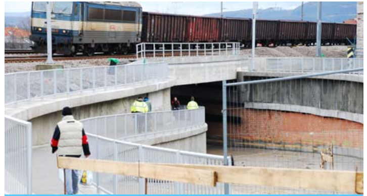
Podjazd na Vlárskej ulici bol pre chodcov daný do užívania v decembri 2015. Cestná komunikácia podjazdu bude uvedená do predčasného užívania v apríli 2016.

Viaceré i niekoľkonásobné omeškania dôvodia komplikovanou situáciou na tomto úseku modernizácie. „Do plnenia zmluvných termínov zasiahli nepredpokladané udalosti, najmä zložitá smerovosť a výškové vedenie inžinierskych sietí. V mnohých prípadoch nekorešpondovali s údajmi, ktoré boli poskytnuté generálnemu projektantovi v čase prípravy dokumentácie, čo spôsobilo nutnosť opätovného zamerania a zisťovania skutočného stavu. V mnohých prípadoch bola zložitá už len samotná identifikácia inžinierskych sietí, rôznych káblov a rúr, objavených pri výkopových