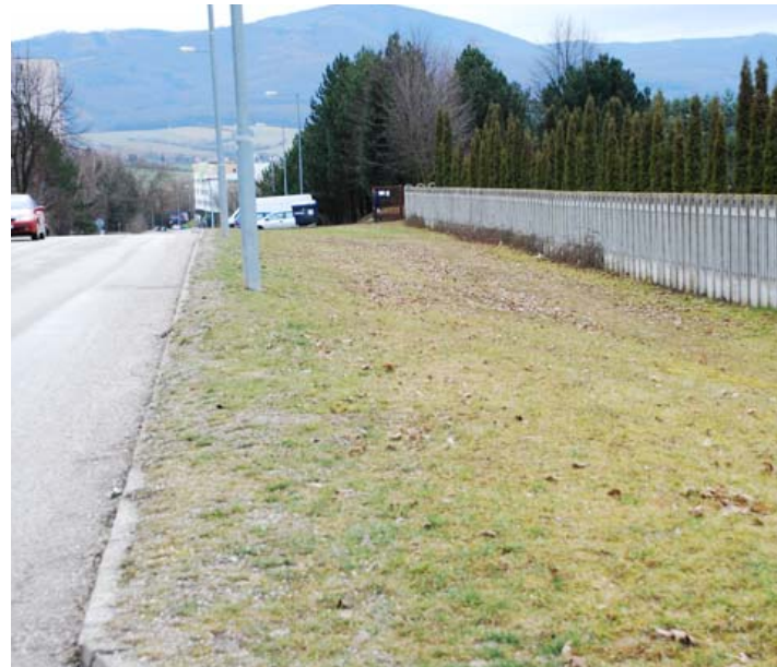
V tomto roku mesto zabezpečí viac parkovacích miest na Saratovskej ulici pri cintoríne.

bude trasovaný po pravej strane Psoťného ulice od okružnej križovatky v smere na Hanzlíkov-