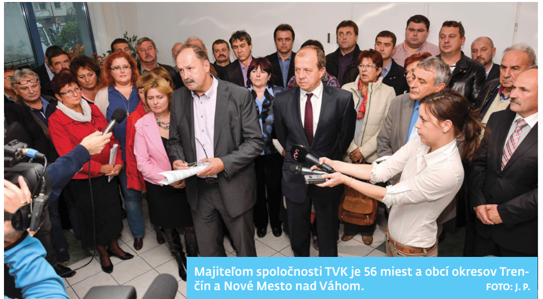
Majiteľom spoločnosti TVK je 56 miest a obcí okresov Trenčín a Nové Mesto nad Váhom.

Súkromná spoločnosť TVS sa vody nechce vzdať. Okresný súd v Trenčíne na základe jej podnetu vydal predbežné opatrenie, ktoré tesne pred našou uzávierkou krajský súd zrušil. Akcionári TVK – 56 miest a obcí v regióne a ich starostovia a primátori už majú dost toho, že súkromná spoločnosť TVS robí problémy pri odovzdávaní