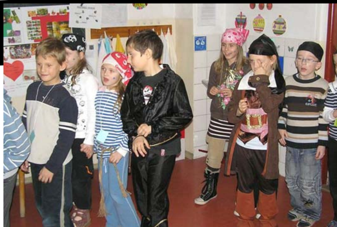
> Základná škola sa na jednu noc premenila na rozprávkový svet pirátov a strašidiel.