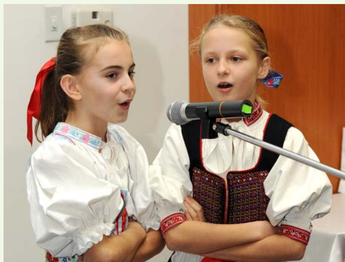
> Súťažiaci spievali ľudové piesne v slovenských krojoch.