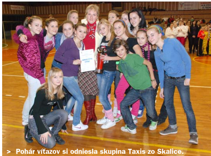
> Pohár víťazov si odniesla skupina Taxis zo Skalice.