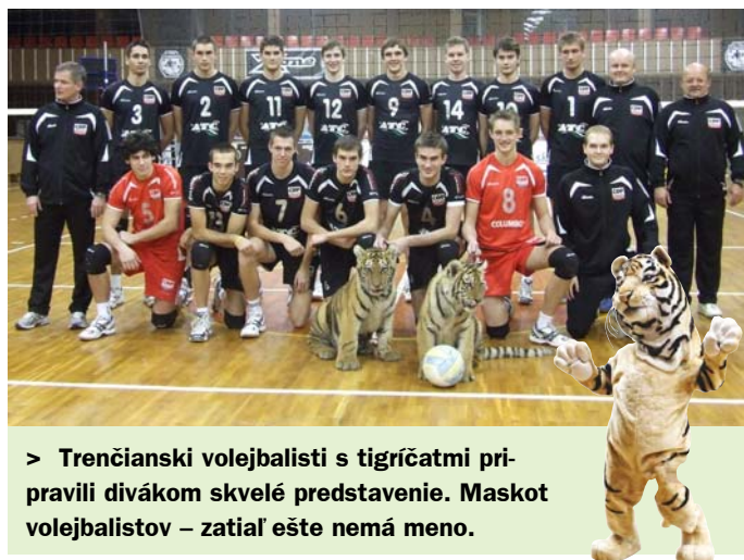
> Trenčianski volejbalisti s tigríčkami pripravili divákovi skvelé predstavenie. Maskot volejbalistov – zatiaľ ešte nemá meno.