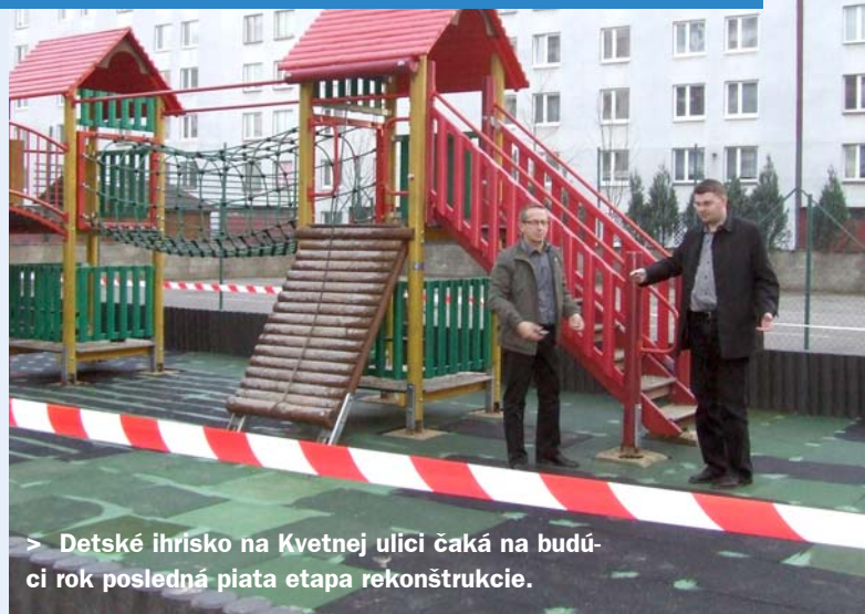
> Detské ihrisko na Kvetnej ulici čaká na budúci rok poslednú piatu etapu rekonštrukcie.