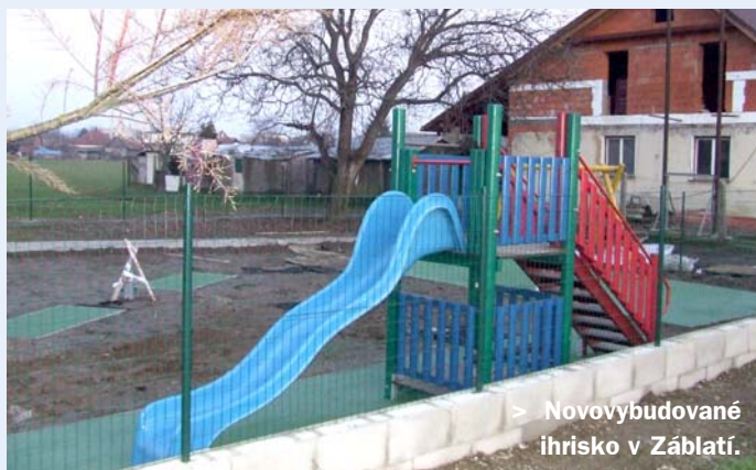
> Novovybudované ihrisko v Záblatí.

cu, ktorý sa stará o ich údržbu a čistotu. „K športovisku s preliezačkami a hojdačkami pribudla v tomto roku aj oddychová časť so skalkou pre seniorov. Pred zimou sa nám podarilo