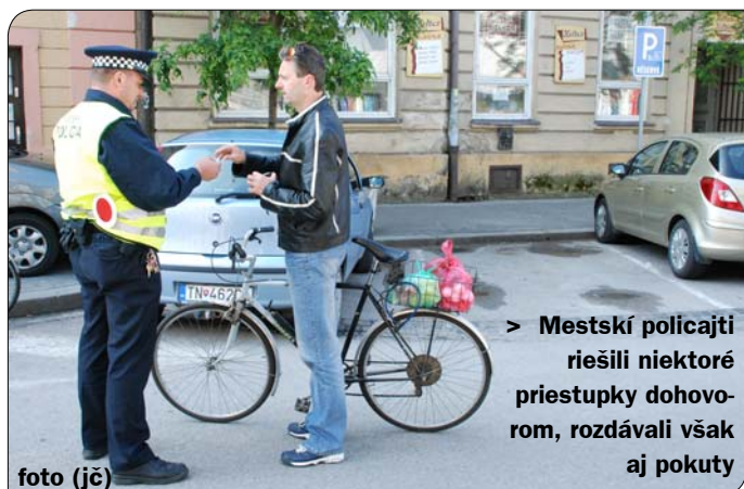
> Mestskí policajti riešili niektoré priestupky dohovorom, rozdávali však aj pokuty

novela zákona o cestnej premávke. Ten umožňuje mestskému policajtovi uložiť pokutu až do výšky 66 eur. „Cieľom tejto preventívnej akcie, nebolo rozdávať pokuty, ale skôr upozorniť cyklistov aj vodičov na pravidlá cestnej premávky. Niektoré priestupky sme teda riešili len ústnym dohovorom, v niektorých prípadoch však boli uložené aj pokuty. Počas akcie sme zaznamenali 32