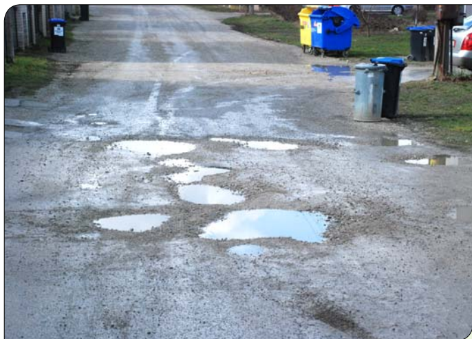
> Široká ulica by mala dostať asfaltovú pokrývku ešte v tomto roku.

plány stroskotali na majetkovo – právnom vysporiadaní pozemkov pod Širokou ulicou, ktoré sú majetkom Rímskokatolíckej farnosti Trenčín – Orechové. „Podnikli sme viaceré rokovania so správcom farnosti a farskou radou v Orechovom. Za rozbitú cestu na Širokej sme ponúkli na výmenu upravený asfaltový úsek cesty pred miestnym kos-