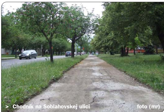
&gt; Chodník na Soblahovskej ulici

Prostredníctvom dodávateľskej firmy je v súčasnosti realizovaná okrem čistenia mestských komunikácií aj stavebná údržba. Tá zahŕňa úpravu výtlkov na cestách, opravu uličných vpustí, žlabov, schodov, prístreškov autobusov MHD či chodníkov pre peších.