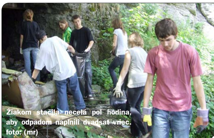
Ziakom stačila necelá pol hodina, aby odpadom naplnili dvadsať vriec.