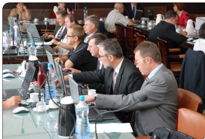
> Mestskí poslanci sa stretli na júnovom zasadnutí.

Záver zasadnutia už tradične patril interpeláciám poslancov a tentokrát aj projekcii návrhov nového územného plánu mesta. (mr)