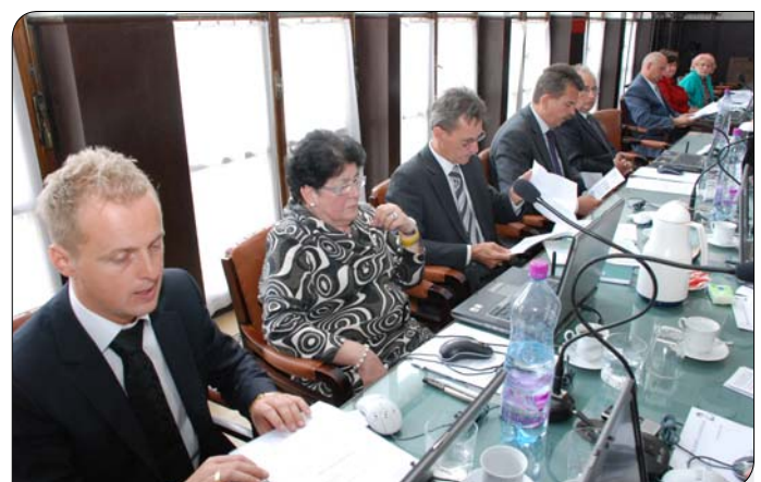
> Poslanci na poslednom zasadnutí odsúhlasili vstup významného investora do priemyselného parku

„V dnešnej dobe, kedy každý deň ľudia prichádzajú o miesta v dôsledku krízy, považujeme tento cieľ nového investora za najdôležitejší,“ dodáva B. Celler. Príchodu investora predchádzali, podľa jeho slov, náročné, niekoľkomesačné rokovania. Do mestskej kasy v tomto roku prinesie predaj uvedených pozemkov 2,55 mil. eur (76,8 mil. Sk). Niektorí poslanci nehlasovali za predaj pozemkov, pretože podľa ich vy-