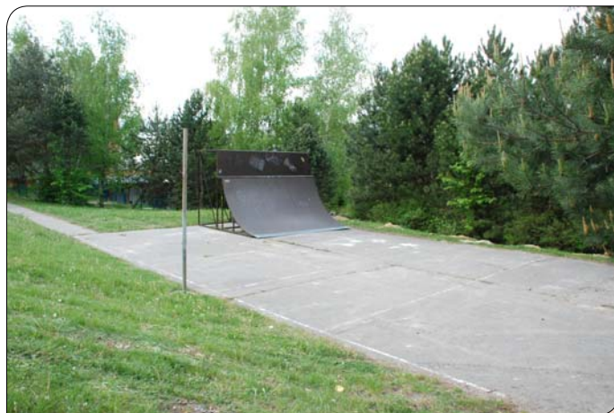
> Mesto už začalo presúvať skejtpark na asfaltové plochy pri Základnej škole na Novomeského ulici.

plochy na pozemkoch vedľa tenisových kurtoch. Napokon však mesto uprednostnilo presunutie parku na asfaltové plochy do zrekonštruovaného športového areálu Základnej školy na Novomeského ul. Skejtbordisti by ho mohli začať využívať už začiatkom mája. „Keďže sezóna sa už začala, pracujeme