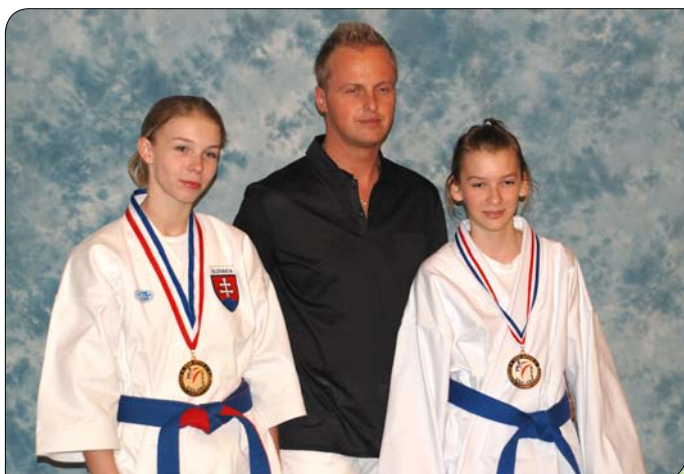
> Tréner a jeho úspešné zveranky

Výprava odlietala na súťaž do Spojených štátov s niekoľkodňovým predstihom, aby sa všetci stihli v novom prostredí