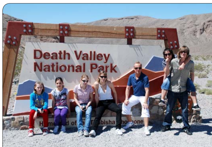
> Karatisti na výlete v Death Valley

KUMITE je zápas, ktorý má svoje pravidlá. Cieľom je prekvapiť súpera povoleným úderom. Niektoré údery sú bodované. Vyhráva zápasník s väčším počtom bodov.