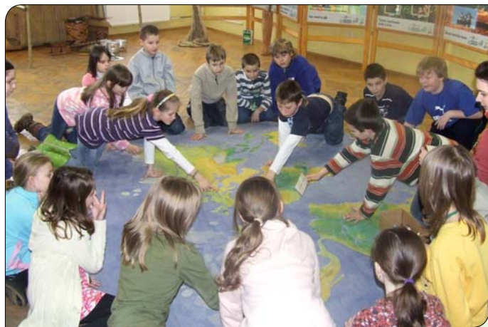
> Veľký úspech mala u žiakov plátenná mapa sveta.

Viac ako sedemsto žiakov materských a základných škôl z Trenčína aj okolia zavítalo v dňoch od 10. do 20. marca do Kultúrneho centra Aktivity na sídlisku Juh. V rámci projektu „Bohatstvo rozvojových krajín“ tu pre nich organizátori pripravili interaktívnu výstavu pod názvom Klíma nás spája.