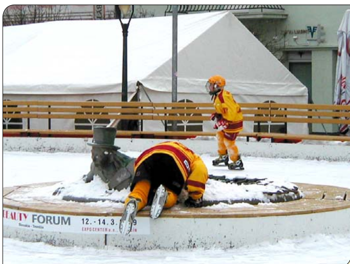
> Posledná porada s vodníkom a ideme na to...

na revitalizáciu detských ihrísk a oddychových zón.“ Doplnil, že cieľom projektu je pokračovať v rekonštrukcii ihrísk Zámostí, treba však hľadať nové zdroje financovania. „Čítim spoločenskú objednávku na vyššiu kvalitu a bezpečnosť. Po skúsenostiach z rekonštrukcie ihrísk a hľadania kontaktov vidím v tejto spolupráci možnosť