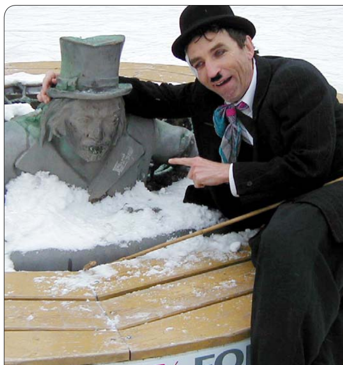
> Mívkvi kamaráti