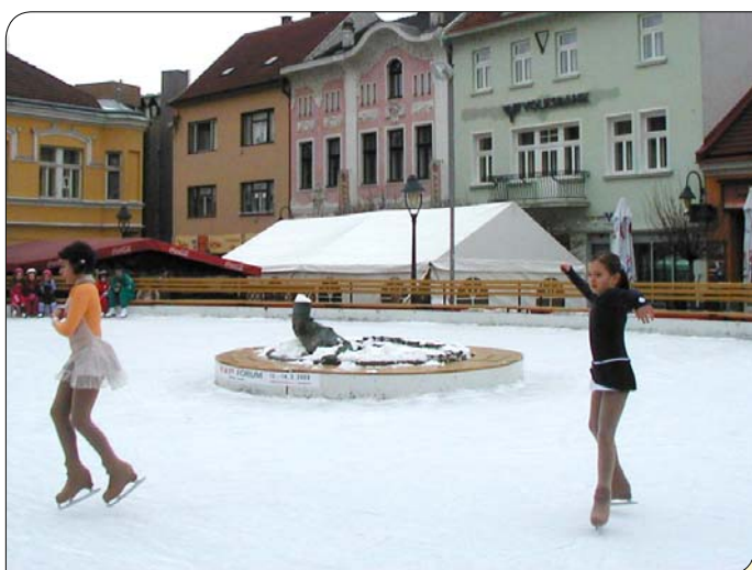
> Dievčatá, nebojte sa ma, podte bližšie...