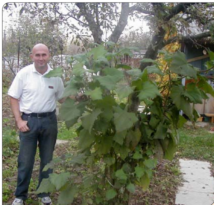
> Aztécké zemiaky môžu dorásť až do výšky dvoch metrov

čil úrodu ovocia, mali záhradkári čo ponúknuť obdivovateľom ovocia.