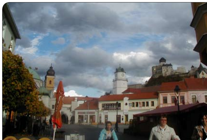
> Text pod foto počasie: Nestále jesenné počasie s častými zmenami dokáže takto „vyzdobiť“ Trenčín. (Ia)