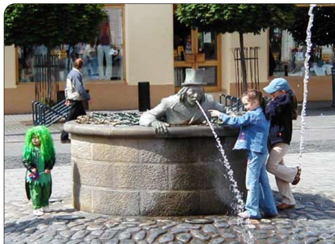
> Chladné jesenné dni síce vystriedali na chvíľu teplé dni babieho leta s teplotami šplhajúcimi sa k 20°C, ale fontány v meste aj napriek tomu osireli, aby ich neprekvapil figliar Mráz. (la)