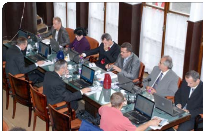
> V Auparku mesto vyrokovalo priestory za korunu pre nové centrum pre seniorov

Viacerí poslanci sa vrátili pri téme Auparku k samotnému umiestneniu stavby. Poslanec