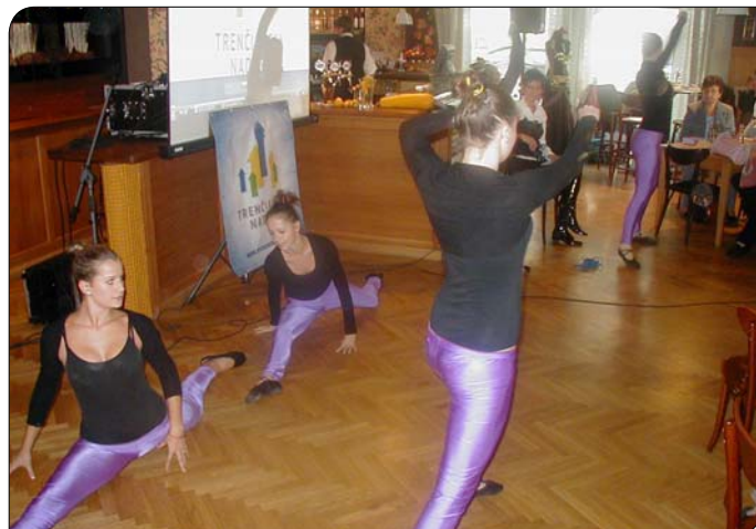
> Napriek stiesnenému priestoru dievčatá s Goonies tancovali ako o život.

„ Obnova sakrálného objektu v lokalite Mišovce – Opa-