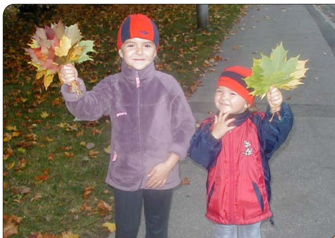
> Jeseň prináša radosť deťom. Padajúce farebné lístie inšpiruje a hra na poštára či umelca sa môže začať.