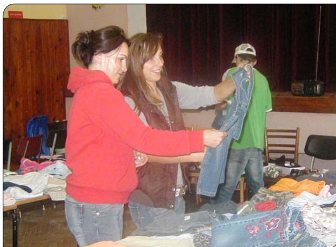
> Deti zo Zelenej školy v Opatovej zorganizovali 10. a 11. októbra burzu spojenú s charitatívnou zbierkou. V Kultúrnom centre v Opatovej bola široká ponuka detského oblečenia, kočiek, potrieb pre deti, hračiek, cédčiek a kníh. Výnos z burzy použijú na nákup potrieb pre Detskú kliniku Fakultnej nemocnice A. Dubčeka v Trenčíne.