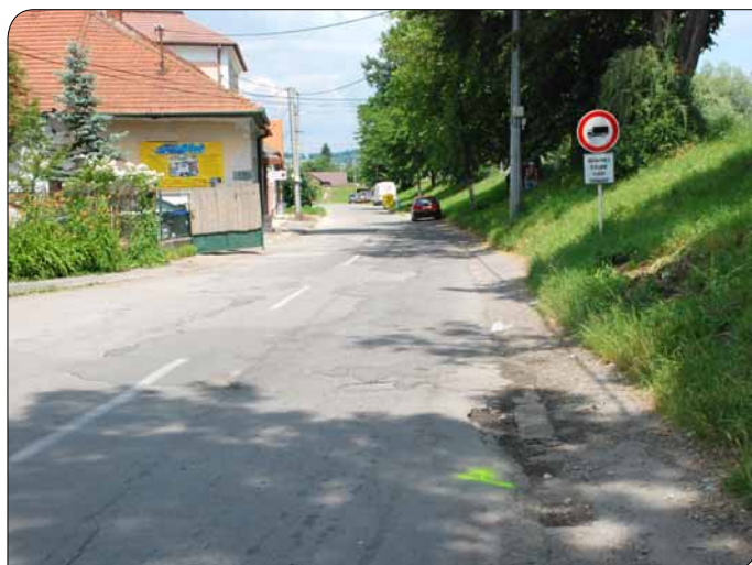
> Ulica L. Stárka pred opravou