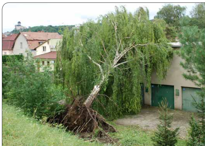
> Spadnutá breza pri garážach na Karpatskej ulici