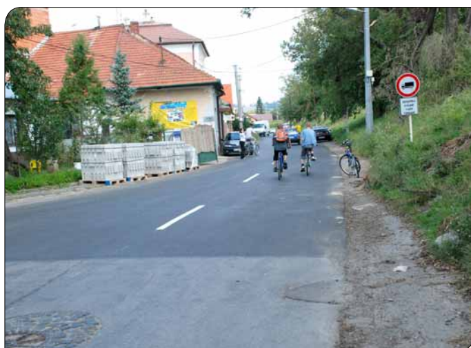
> Nový koberec potešil obyvateľov Ulice L. Stárka aj vodičov.