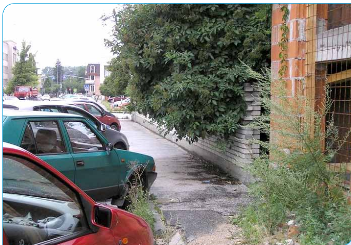
> Konáre prerastajúce na chodník ohrozujú chodcov na Ulici K dolnej stanici.

bezpečí náhradné priestory pre súčasnú činnosť záujmových krúžkov, pokiaľ sa nedostavia objekt, kde sa kultúrne stredisko vráti. Týka sa to aj aktivít Univerzity 3. veku.