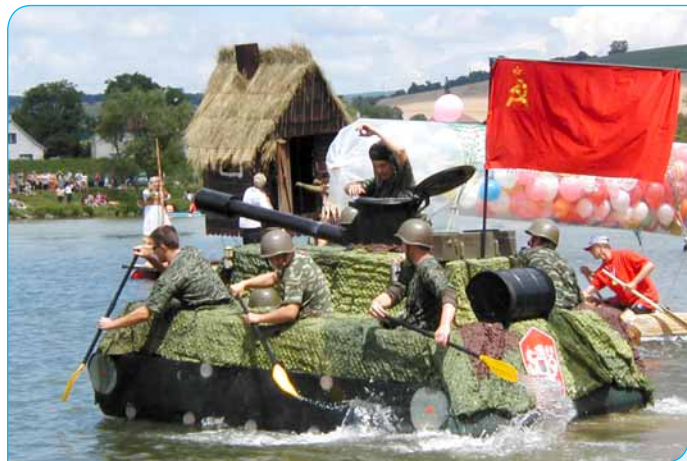
> Tank sa vynoril z roku 1968.

Úderom 10. hodiny začala porota zložená z novinárov hodnotiť koráby. Kombinácia estetiky, farebnosti, úrovne zhotovenia stavby, technickej náročnosti, fantázie, vtipu a myšlienky plavidla kládli vysoké nároky aj na porotcov. Museli prihliadnuť aj na kostýmy, masky a oblečenie posádok, súlad s plavidlom a vtip počas predstavovania. Navyše museli všetky plavidlá obstáť v najťažšej skúške a na pravé poludnie sa hodinu plaviť po vetrom bičo-