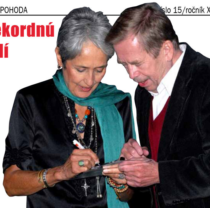
Joan Baez sa podpisuje Václavovi Havlovi

hoda. Strom roka je súčasťou grantového programu Nadácie Ekopolis – Ľudia pre stromy,