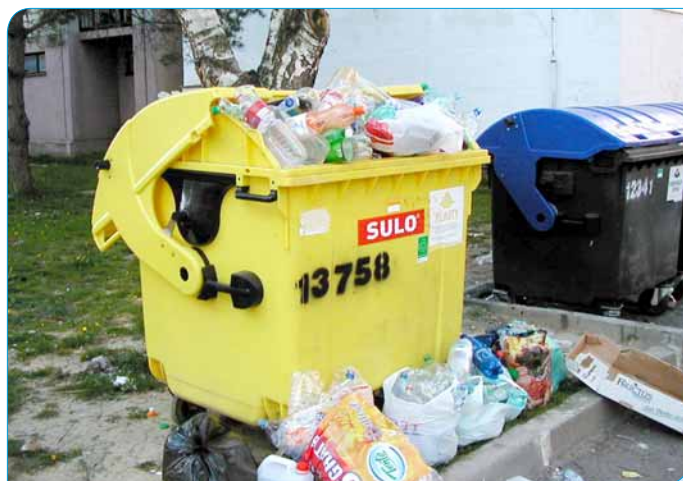
> Na disciplínu pri ukladaní odpadu do kontajnerov upozorňujú trenčianski dôchodcovia.

Triedenie komunálneho odpadu sa stalo v mnohých rodinách samozrejmosťou. Niektorí obyvatelia sa správajú ako keby žili v meste sami. Kontajnery na plasty sú po vyspaní zaplnené vrecami s uzavretými plastovými fľašami, pričom stačí fľašu otvoriť, stlačiť a potom zaberie meňšieho miesta.