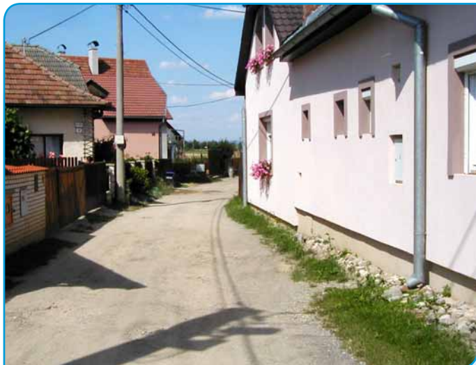
> Ďažďová voda steká zo šiestich domov na cestu na ulici Zelnica.

Výbor mestskej časti (VMČ) Sever na svojom júlovom stretnutí s občanmi opäť rokoval o prístupe na hrádzu zo Žilinskej ulice (o probléme sme písali v čísle 14), o stave detských ihrísk na Sihoti, prestavbe kotolne na Považskej ulici na pevné palivo a o situácii v ulici Zelnica.