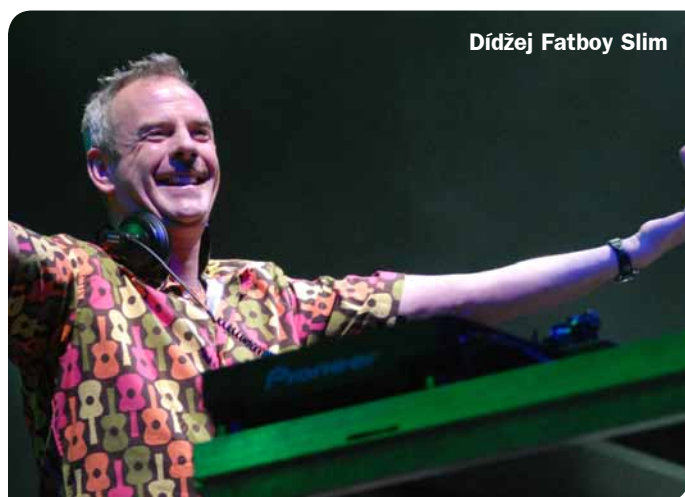
Dídžej Fatboy Slim

dvoch dní v neustálej permancii a vystriedalo sa na nich 150 interpretov z 20 štátov. Okrem hudby sa pozornosti tešili divadelné a filmové predstavenia, škola tanca a čoraz populárnejšie diskusné kluby. Až 32 mimovládnych organizácií rozprestrelo svoje stánky na Trhovisku neziskoviek na