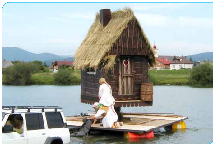
> Domček na stračeí nůžke spúšťajú na vodu.

V sobotu 5. júla zaplnilo asi 15-tisíc divákov obidva brehy Váhu v priestore pláže na Ostrove. Od rána privádzali konštruktéri do priestoru štartu Splanekoru 2008 (skratka znamená Splav netradičných korábov) plavidlá od výmyslu sveta. Staviteľia sa prekonávali a nešetrili fantáziou pri tvorbe súťažných lodí a pri vymýšľaní ich názvov.