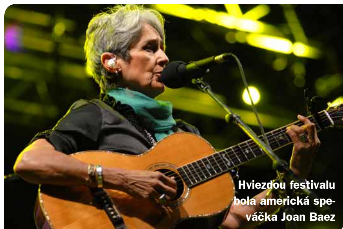
Hviezdou festivalu bola americká speváčka Joan Baez

Dvanásť stromov súťaží do októbra o víťazstvo v ankete Strom roka 2008. Hlasovanie v ankete Strom roka 2008, ktorú vyhlásila Nadácia Ekopolis 85, sa začalo na festivale Po-