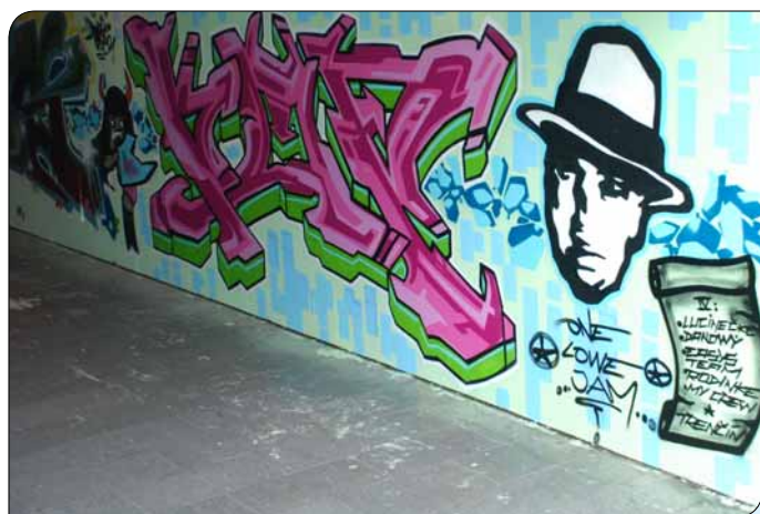
> Ako legálna plocha pre grafity slúži už dnes podchod pod Hasičskou ulicou.

vážnom nariadení (VZN), ktoré 26. júna schválili poslanci mestského zastupiteľstva. Na graffiti poslanci určili oporný múr za Gastrocentrom a Centrumom na Hviezdoslavovej ulici, steny telocvične Základnej školy v Trenčíne na Hodžovej ulici, podchod na Noviny pod Električnou ulicou, stenu na konci Kuzmányho ulice smerom k podchodu Električná – K dolnej stanici, steny tribún futbalového štadióna na Sihoti s výnimkou hlavnej tribúny, betónový plot areálu letného kúpaliska, vnútorné steny podchodu na Juhu pri cintoríne, cestný podjazd na Ulici Jesenského, múrik pri stredisku Družba na detskom ihrisku, oporné múry na Kukučínovej ulici a podjazd z Východnej ulice na Ulicu generála Svobodu.