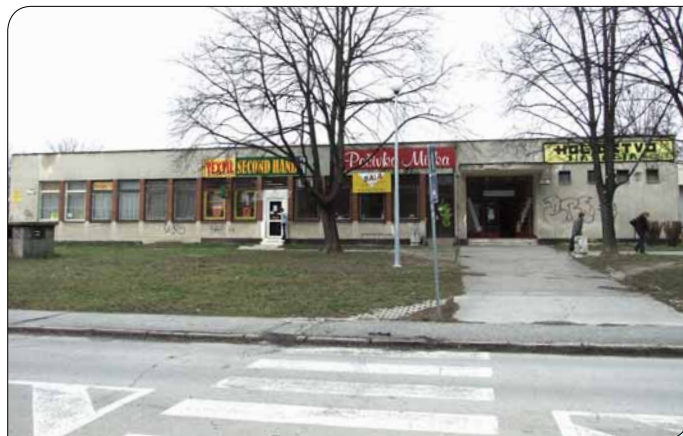
> Staré budovy kultúrnych stredísk, ktoré potrebujú radikálne riešenie, nahradia moderné budovy.