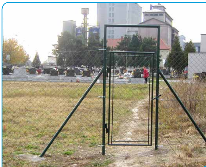
> Nová plocha cintorína v Zlatovciach je oplotená, ale zatiaľ sa tu pochovávať nesmie.

svietiace lampy verejného osvetlenia počas štyroch dní v tomto roku. Poslanci vysvetlili nutnosť opráv osvetlenia a doplnili, že mesto neplatí za elektrinu spotrebovanú v tieto dni.