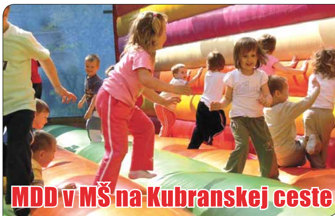
MDD v MŠ na Kubranskej ceste

V Materskej škole, Kubranská cesta už niekoľko rokov MDD znamená Týždeň plný radosti. Najskôr prišiel kúzelník a okrem iných kúziel a čarovania nám pričaroval nádherné počasie. S veľkou pozornosťou a aj rešpektom sa deti pozerali na policajtov a ukážky výcviku so psami. Ujovia policajti sú však kamaráti všetkých detí a priviezli k nám šteniatko, ktoré nakoniec chcelo zostať s deťmi