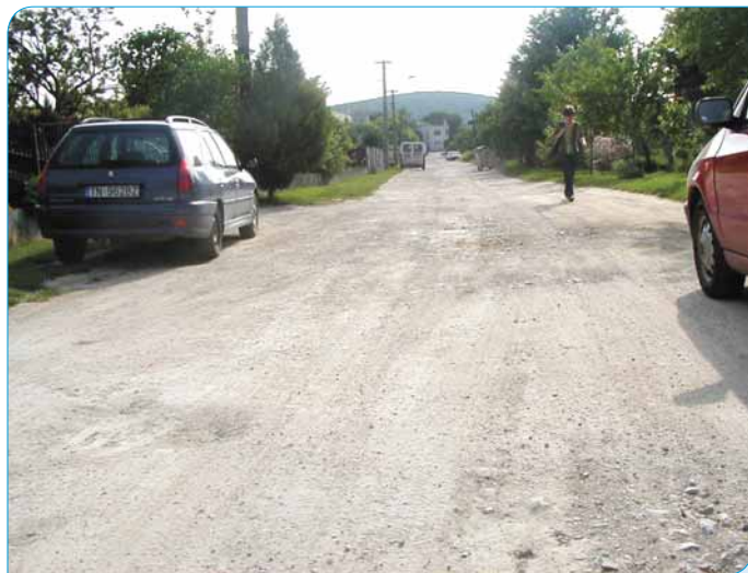
> Stav Širokej ulice je aj výsledkom nevysporiadaných majetkov.