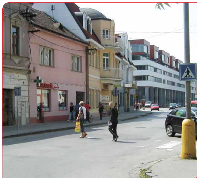
> Vodorovné dopravné značenie nielen priechodov pre chodcov, je v týchto dňoch obnovované.