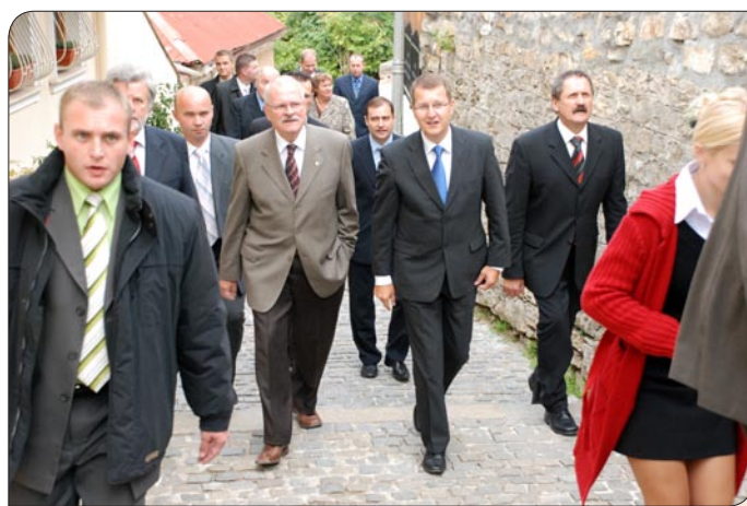
> Počas prehliadky Ulice Marca Aurelia.