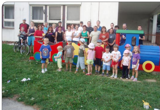
> Rodičia s deťmi po úspešnej brigáde

budú organizované podobné akcie, ako nám bolo prisľúbené. Pevne verím, že sa v budúcnosti zapojí a trošku zo svojho voľného času venuje ešte viac rodičov, ako tomu bolo teraz. Boli by sme radi, keby sa našli aj nejakí sponzori, ktorí by nám prispeli k skvalitneniu materskej školy. Aj táto MŠ by si zaslúžila časť rekonštrukcie, nakoľko okrem kvalitného vzdelávania našich detí na výbornej úrovni by mala dostať aj lepšiu vonkajšiu vzhľad. Za celú akciu sa treba poďakovať okrem rodičov aj pani učiteľkám, pani ku-