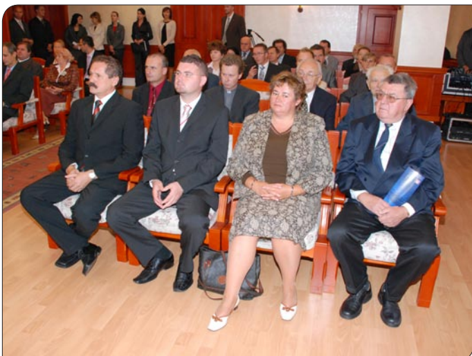
> Osobnosti Trenčína sa stretli s prezidentom v sobášnej sieni.