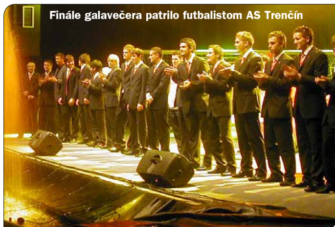
Finále galavečera patrilo futbalistom AS Trenčín

Druhý polčas programu vyvrcholil nástupom celého kádru AS na javisko sprevádzaný