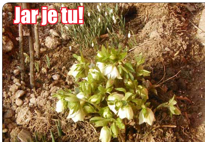
Hoci počasie je nevyspytateľné, jar už možno cítiť vo vzduchu aj vidieť v trenciánskych záhradách.

otázky týkajúce sa kompetencií samosprávy, samozrejme podpísané, môžete adresovať aj na stránku www.trencin.sk , konkrétne na sekciu Otázky a odpovede, kde zodpovedná pracovníčka vaše žiadosti o odpovede urýchlene vybaví. Táto služba slúži občanom Trenčína, ale aj ostatným záujemcom už niekoľko mesiacov. Čakáme na ďalšie vaše príspevky, ktoré obohatia strany nášho – vášho informačného dvojtyždenníka INFO Trenčín. (r)