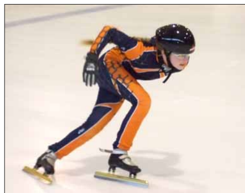
Rýchlokorčuľovanie ide výborne aj dievčatám