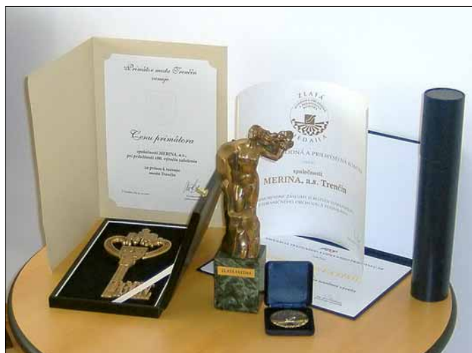
Medzi najvýznamnejšie ocenenia Meriny patrí Zlatá Fatima, Zlatá medaila Slovenskej obchodnej a priemyselnej komory a Cena primátora Mesta Trenčín za prínos k rozvoju mesta.

1963 uskutočnila 1. výstava výrobkov Meriny a Odevy. Práve táto výstava sa stala základom pre budúce výstavy, ktoré sa stali svetoznámé pod názvom Trenčín – mesto módy .