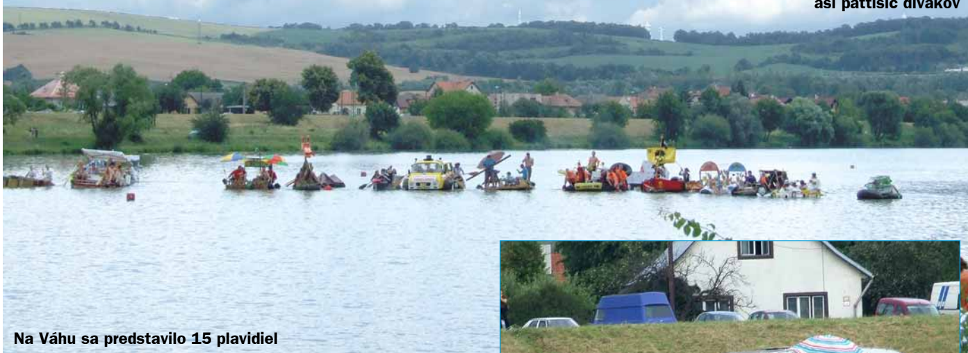
Na Váhu sa predstavilo 15 plavidiel

ská postieľka s mužmi v plienkach, ďalší tím si na plávajúcej záhradke uprostred pokojných trenčianskych vôd opekala na ohni kurča. Nechýbali ani piráti, auto s Flinstonovcami, záhradka s kosačkou a funkčnou sprchou či ekoloď z plastových fliaš, ktorá napokon aj vyhrala prvú cenu – motorový čln a 10-tisíc korún.