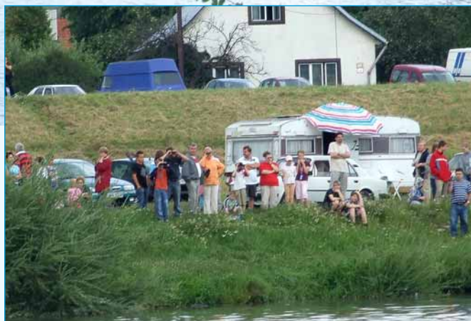
Diváci nechýbali ani na zamarovskej strane Váhu