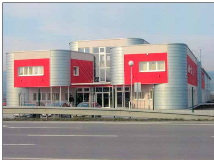
Sídlo firmy Cemdesign na Bratislavskej ul. patrí druhé miesto