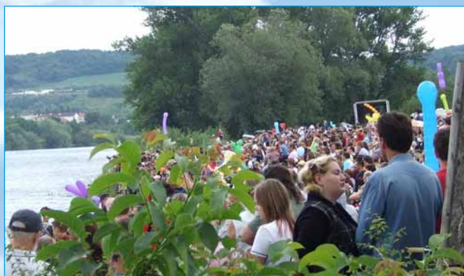
Netradičné podujatie prilákalo na pláž na Ostrove asi päťtisíc divákov

Splanekor prežil šesť ročníkov v rokoch 1981 až 1987. V minulosti tímy nadšencov splavovali Váh na veľkom polystyrénovom kaprovi, na