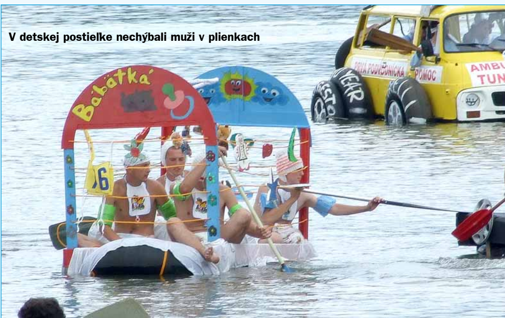
V detskej postielke nechýbali muži v plienkach