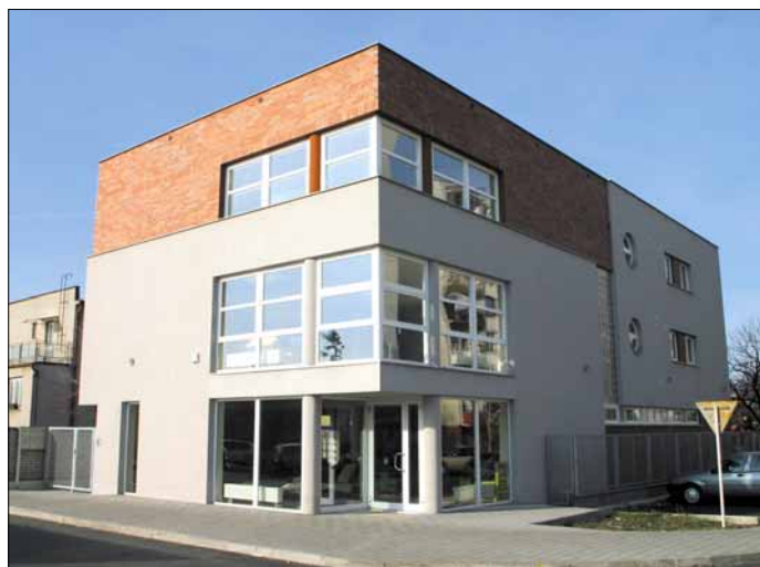
S-dom Za mostami skončil v ankete na 3. mieste