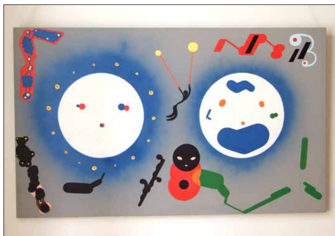
René Hábl: Homo Bulla III