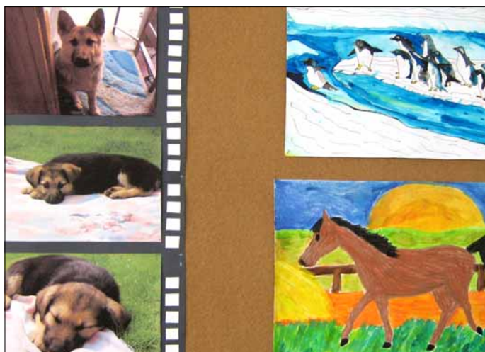
Panel z výstavy s najlepšimi prácami