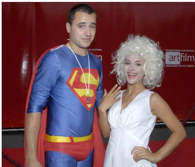
Na otvorenie Artfilmu „prišli“ aj Batman a Marilyn Monroe.