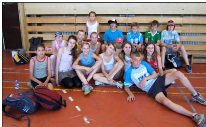
Víťazné družstvo žiakov na Behu Soblahova zopakovalo vlnajšie prvenstvo

Potešiteľné výsledky motivujú žiakov venovať svoju energiu, zmysluplne prežívať voľný čas a v neposlednom rade ich učia byť hrdí na svoju školu. Tá síce nemá na všetky druhy športovania práve najideálnejšie podmienky, žiakom však ponúka možnosť realizovať sa v niektorom z troch športových oddielov pracujúcich pri škole: