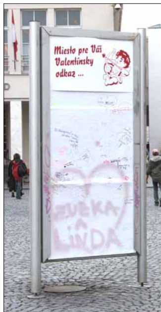
Miesto pre Valentínske odkazy bolo vyhradené aj na Mierovom námestí.

Čo ste cítili z tejto výpovede mladej dvojice? Dúfam, že spokojnosť a lásku. Takéto milé záležitosti by ma bavilo robiť či písať každý deň.