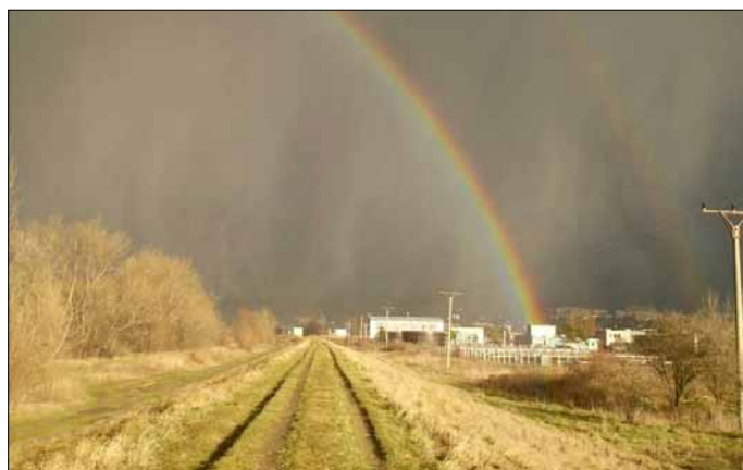
Dňa 4.2.2007 sa Trenčínom prehnala nevededná zimná búrka

Termín uzávierky odovzdania návrhov je 31. marca 2007 . Návrhy vložte do obálky označenej nápisom „Súťaž o najkrajšiu školskú uniformu“ a pošlite na adresu: Útvar školstva a sociálnych vecí, Mestský úrad, Mierové nám. 2, 911 64 Trenčín.