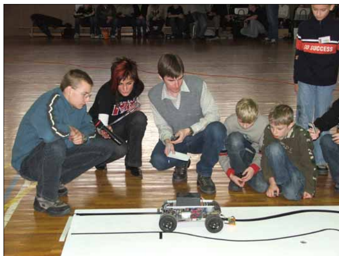
V kategórii driver samohybné roboty museli prekonať čo najrýchlejšie dráhu Snímka (a)