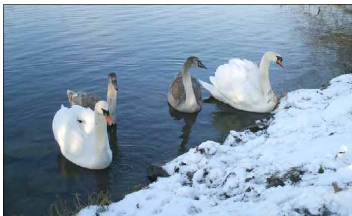
Trenčianska labutia rodina